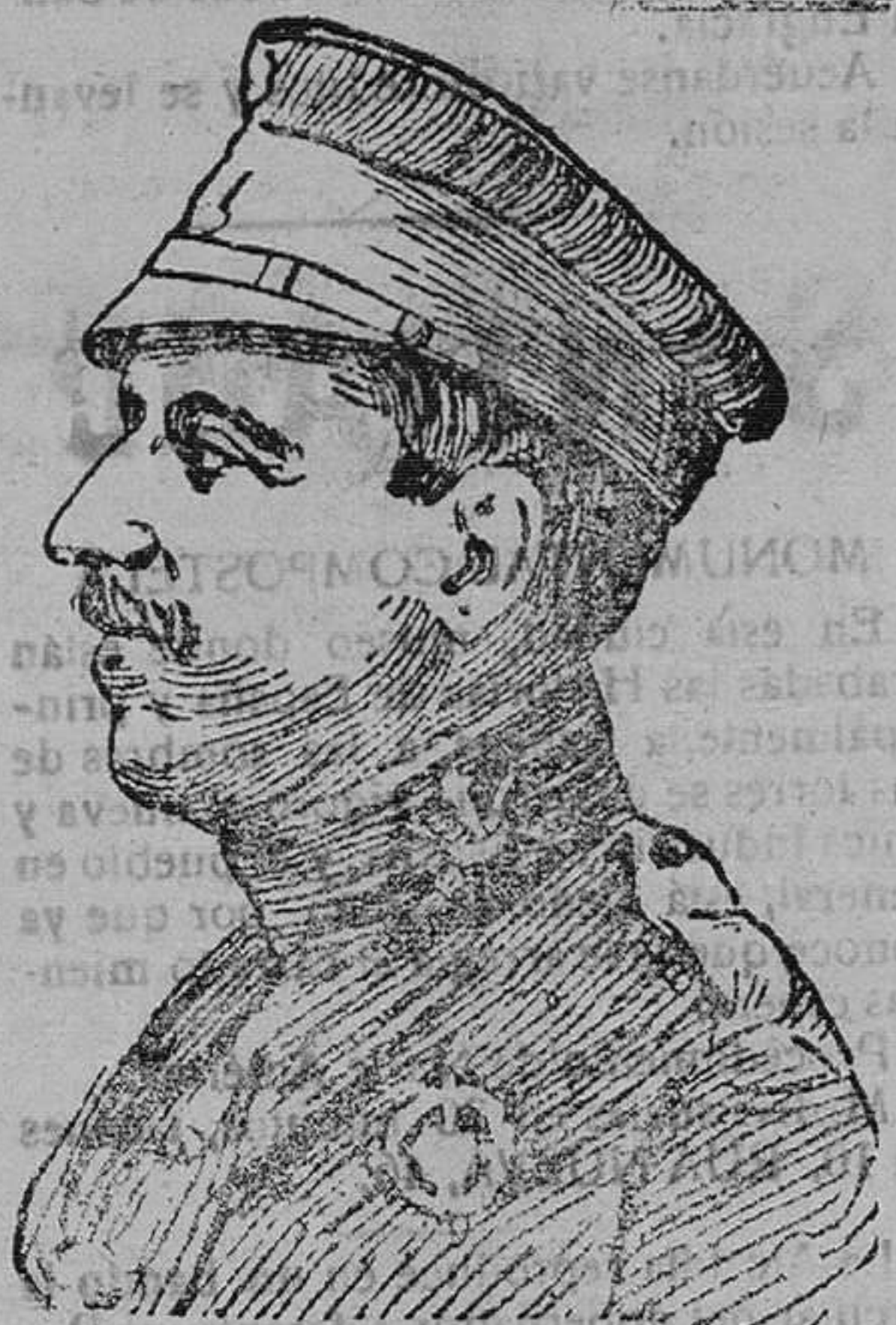
El general D. José Sanjurjo, nombrado Comandante General interino de Melilla