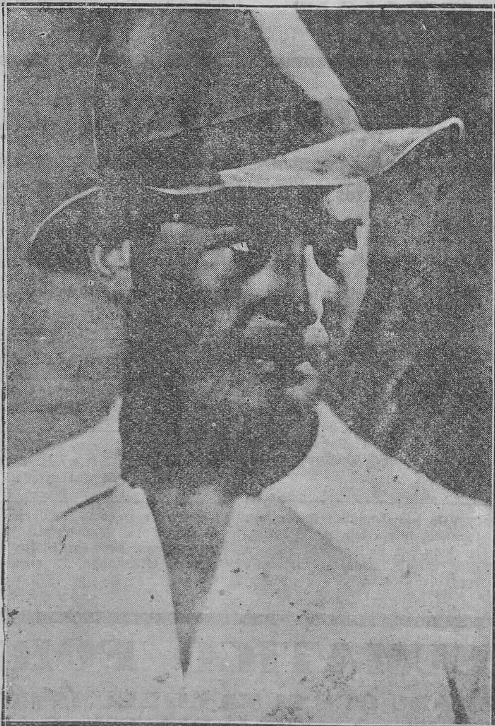
Jan Kiepara, el maravilloso tenor cuya gran actuación en "Todo por amor" ha constituido uno de los más brillantes éxitos en esta temporada.