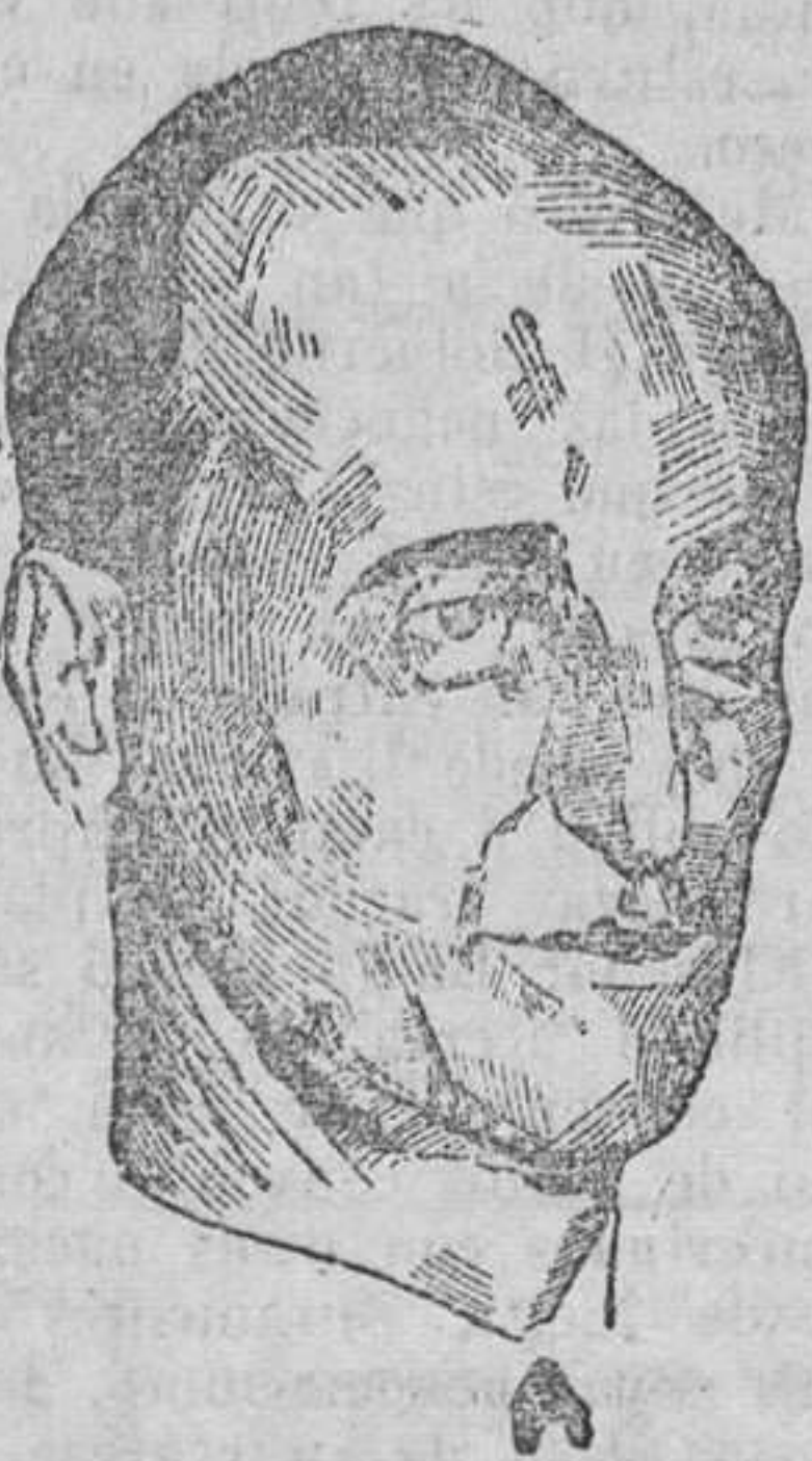
El ministro señor Casares Quiroga. Los médicos le han prohibido que reciba visitas.

MADRID.—Se encuentra enfermo de algún cuidado el ex ministro