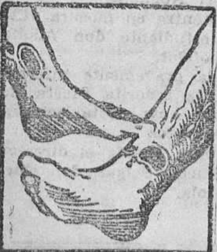
Males en las piernas