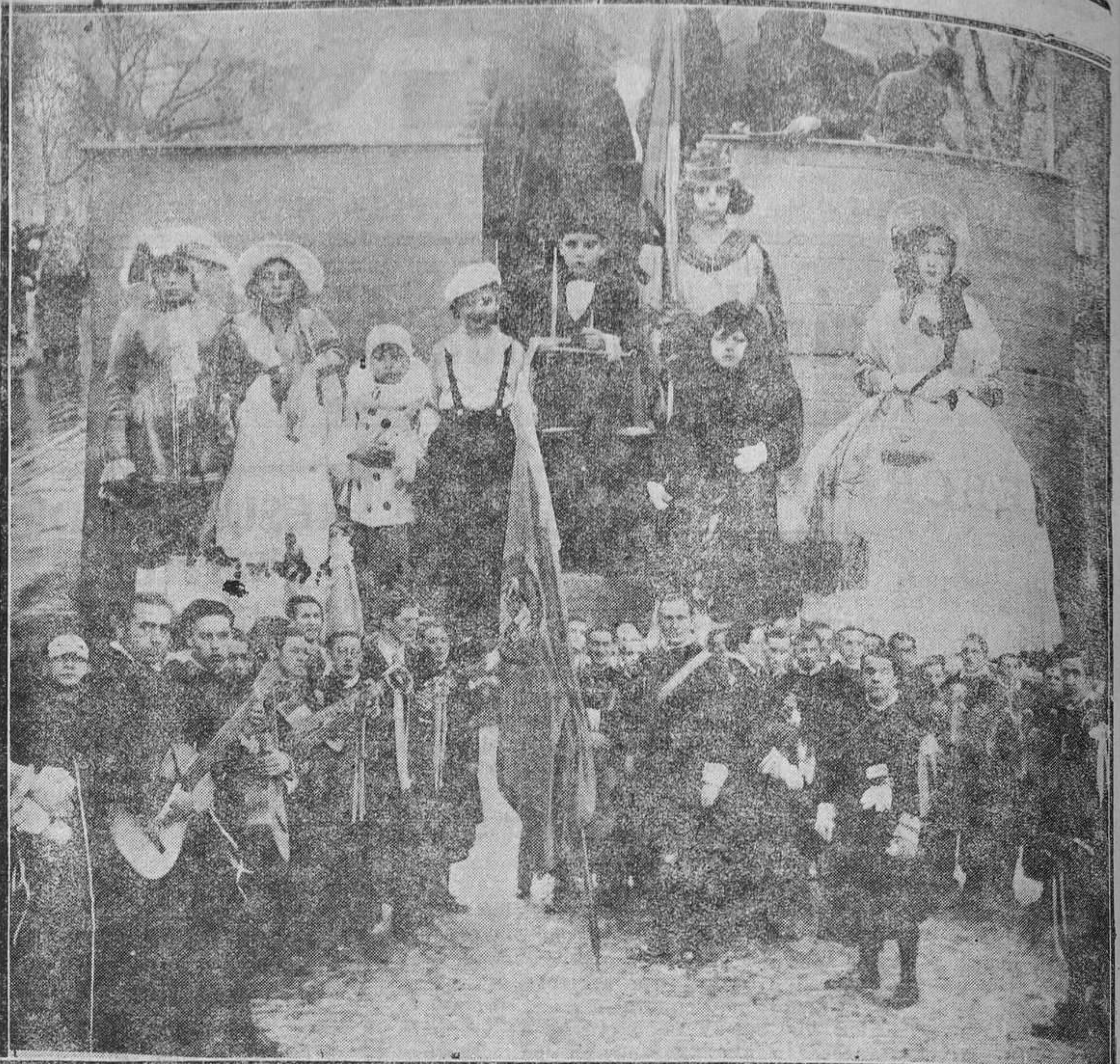
MADRID.—Arriba: Grupo de niños que tomaron parte en el concurso de disfraces. Abajo: La Tuna de Valladolid, que se presentó al concurso de estudiantinas.

Por la tarde de ese mismo día, y a las tres y media, los aspirantes del grupo E. se presentarán