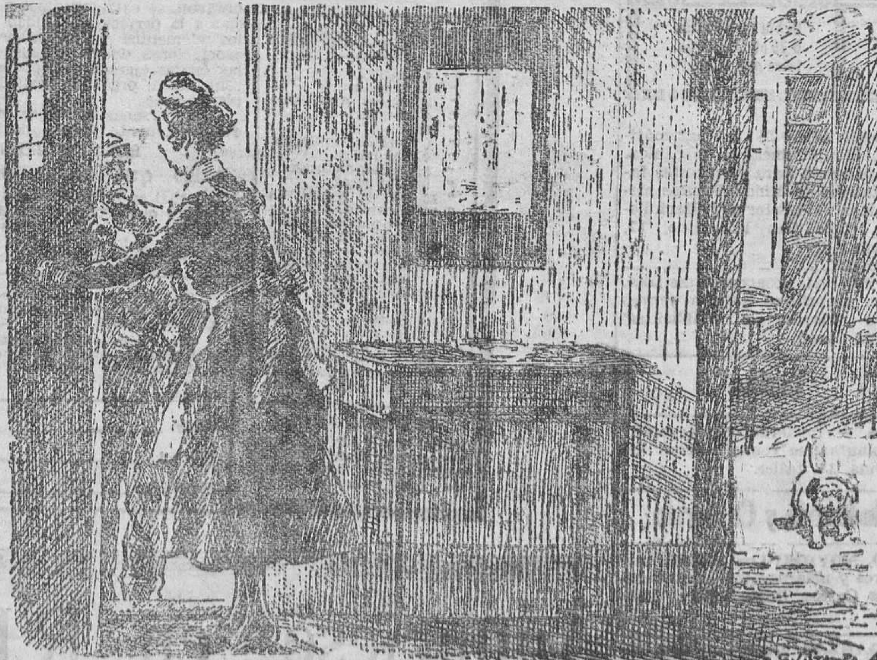
LA MUCHACHA.—¿Qué desea usted? EL LADRON.—Lo primero que encuentra.

"Declarado el día de mañana, 11 del corriente, Fiesta Nacional, por disposición del Gobierno, en conmemoración de la proclamación de la primera República española, he acordado ponerlo en su conocimiento y significarle mi deseo de que lo haga saber a todos los organismos afechos a esta Cámara, para que cierren los establecimientos a la hora de costumbre en tales días festivos."