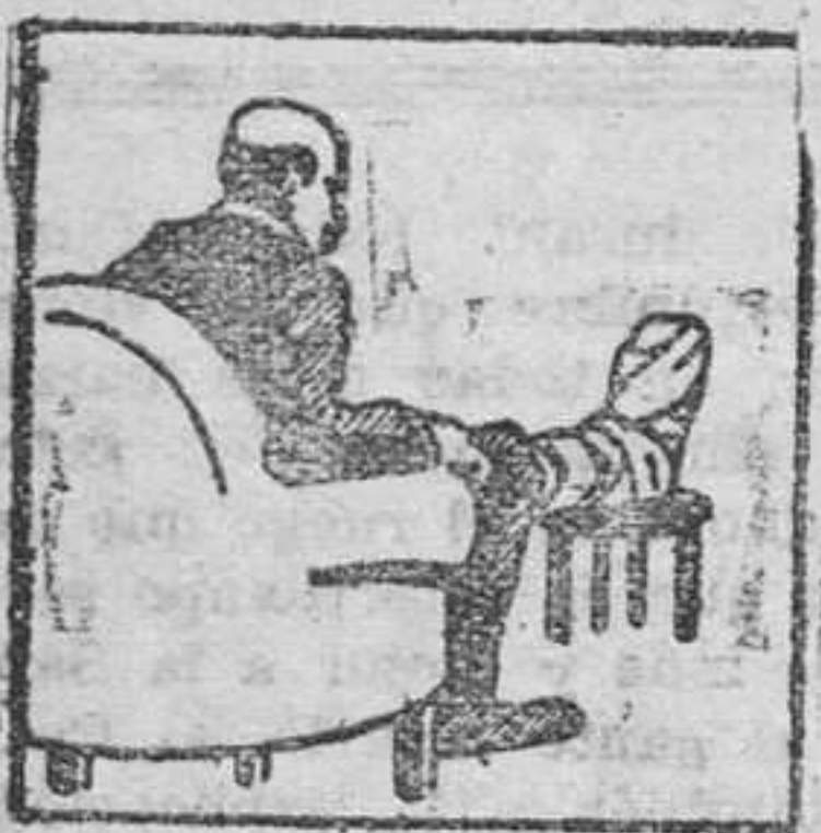
Gota - Dolores