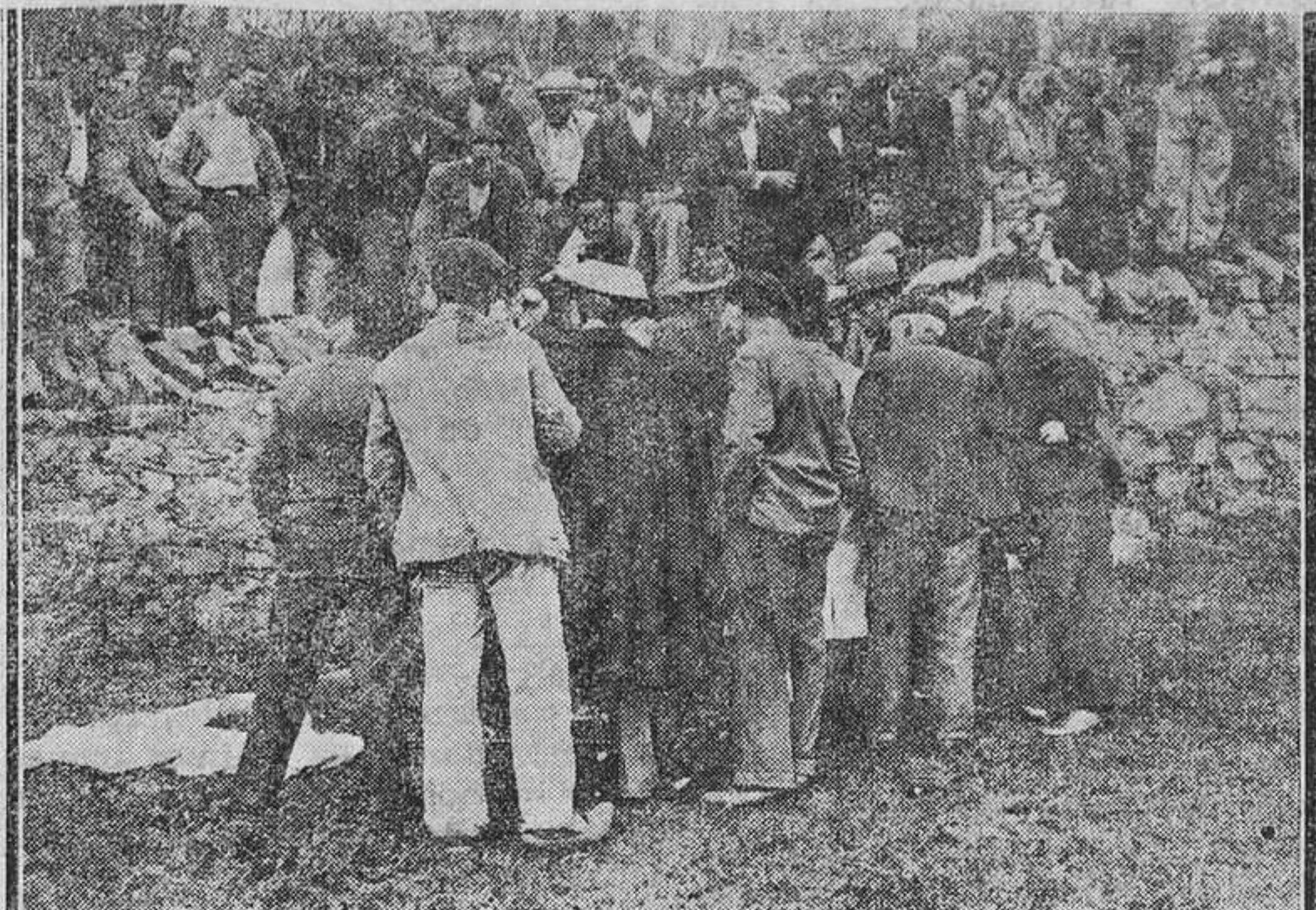
El Juzgado instruyendo las primeras diligencias. (Foto Castellanos).

Al lado del cadáver y como a unos cuarenta centímetros de la