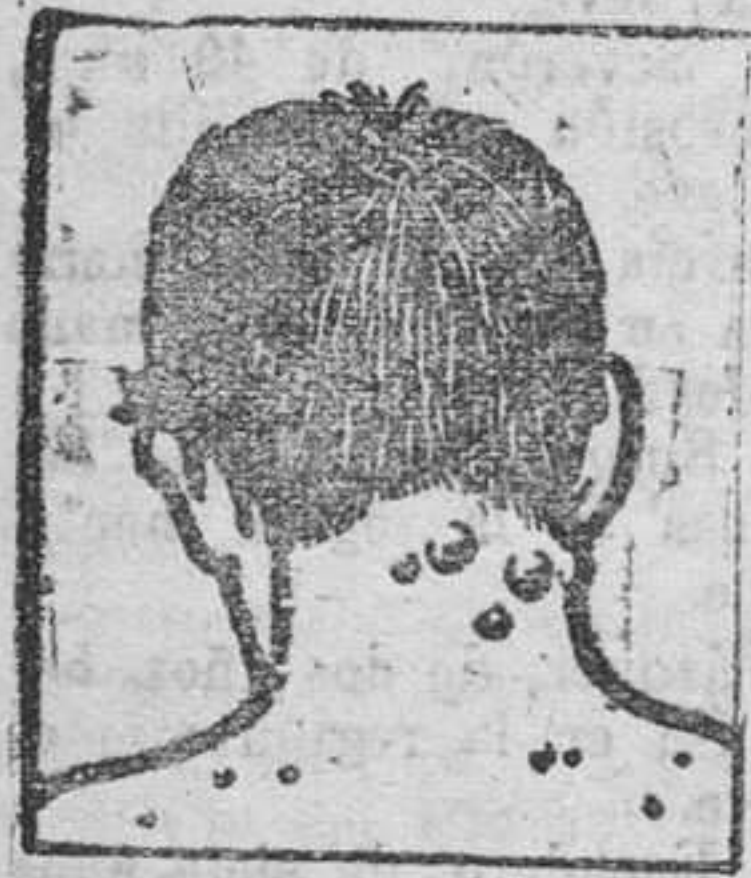
Granos - Forunculosis

Tengo tambien de los consumidores de España frecuentes testimonios de curaciones maravillosas obtenidas con el uso de mi Depurativo. No los publico sin embargo por sujetarme al deseo expresado por los mismos de no dar a conocer sus nombres respetando asi su natural reserva. Pida Vd hoy mismo un folleto gratuito al Laboratorio Richelet, San Sebastian, 22, San Bartolomé.