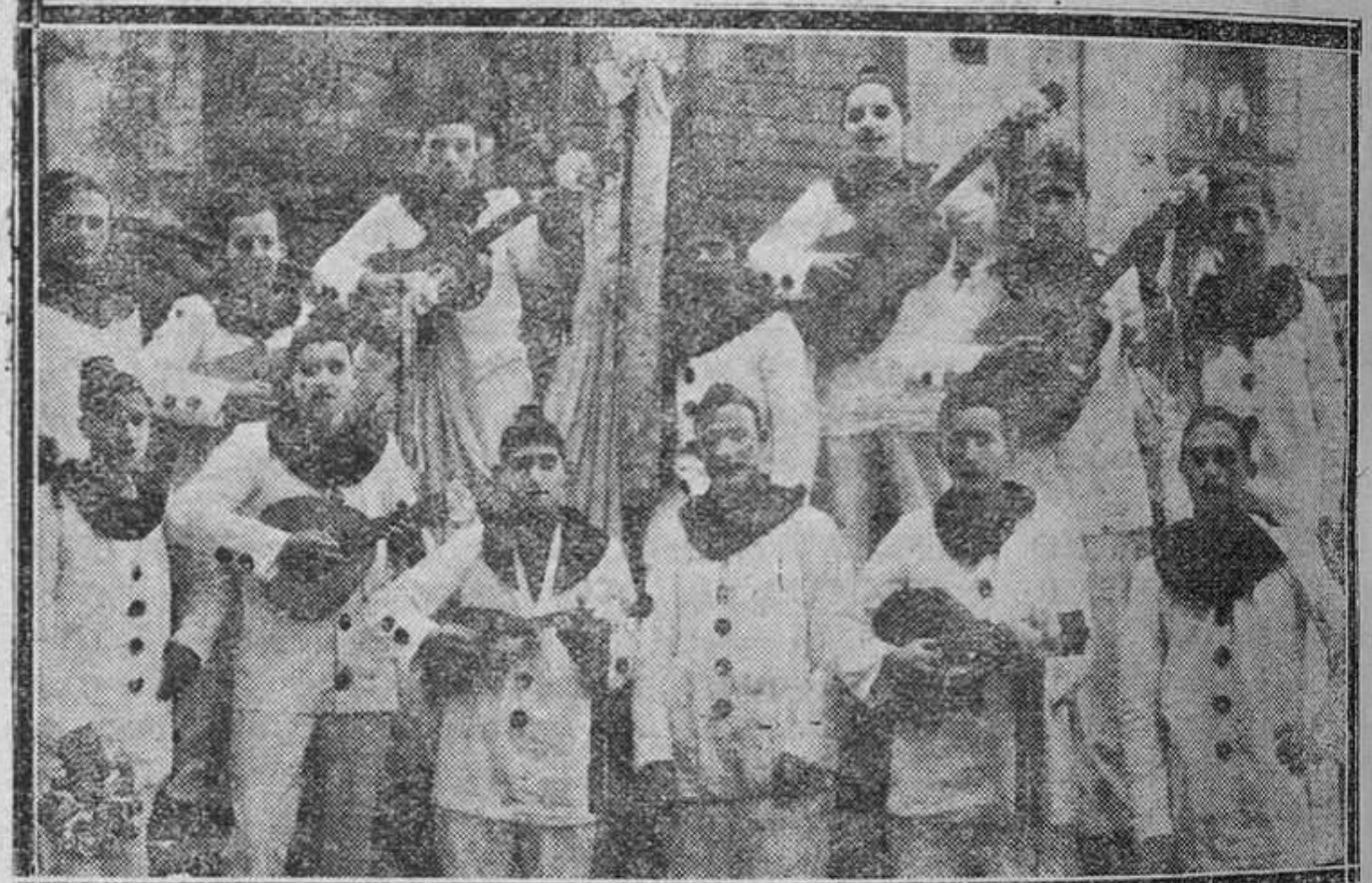
GRADO.—La "Rondalla Gradense", que ha conseguido muchos éxitos en su tourné por Asturias durante los Carnavales.

Bajo ningún pretexto será permitido el consultar libros, diccionarios o apuntes durante las conferencias, ni en los descansos entre clase y clase.