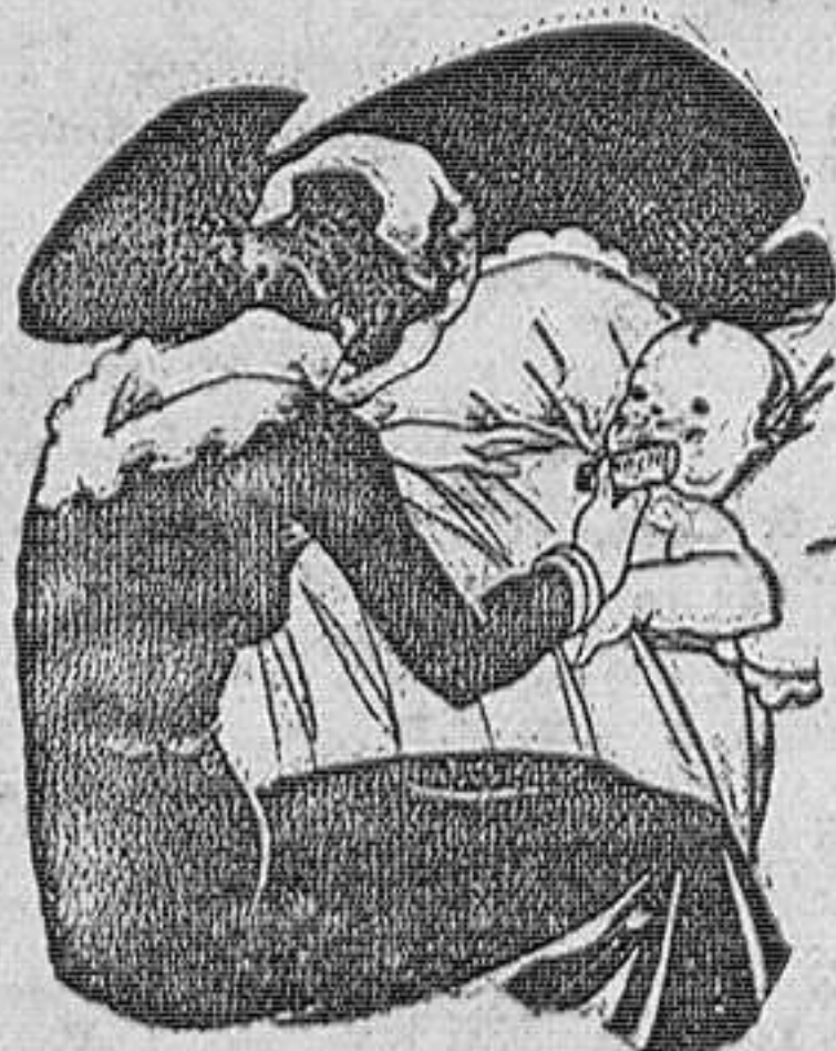
Tos - Catarros - Bronquitis Congestiones