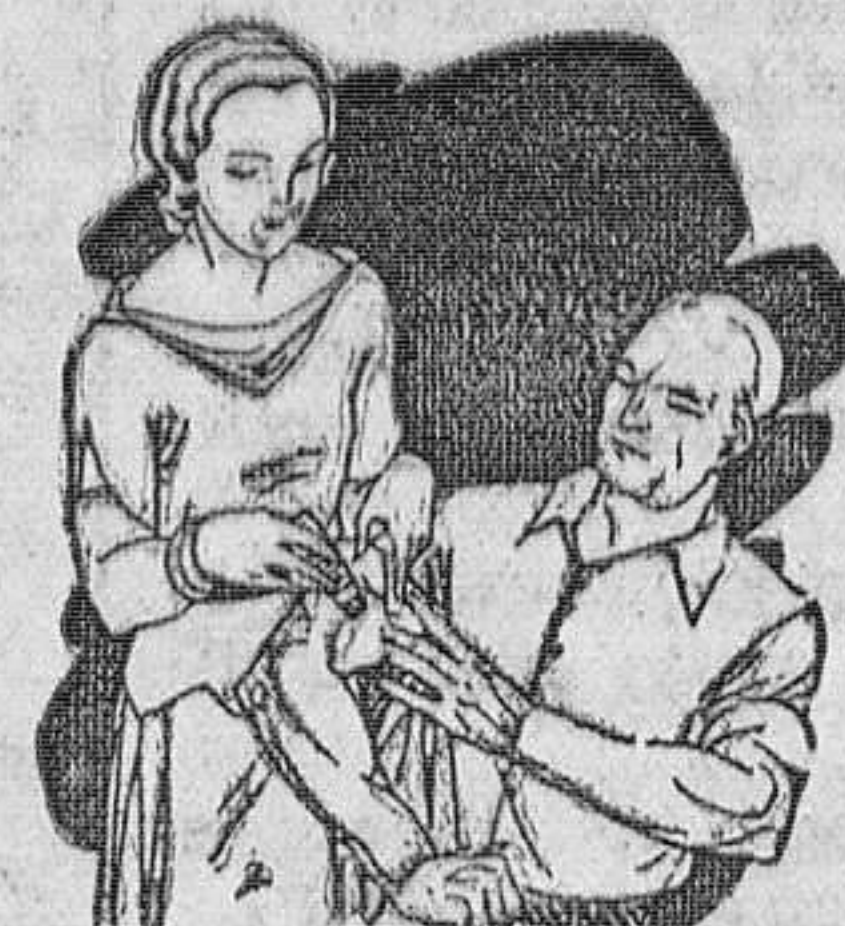
Dolor en las articulaciones Calambres

El LAPIZ TERMOSAN es el Revulsivo más práctico y eficaz contra toda clase de dolores y congestiones.