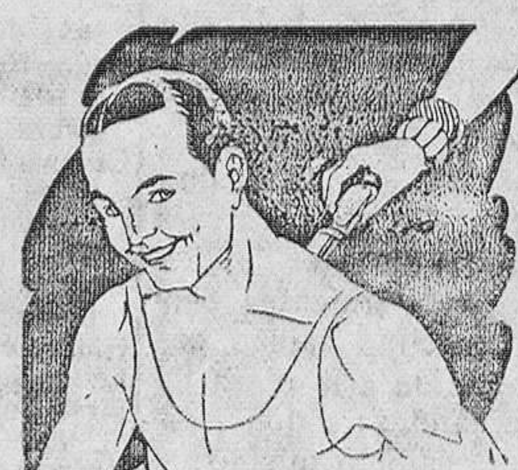
Rigidez del cuello Torticollis