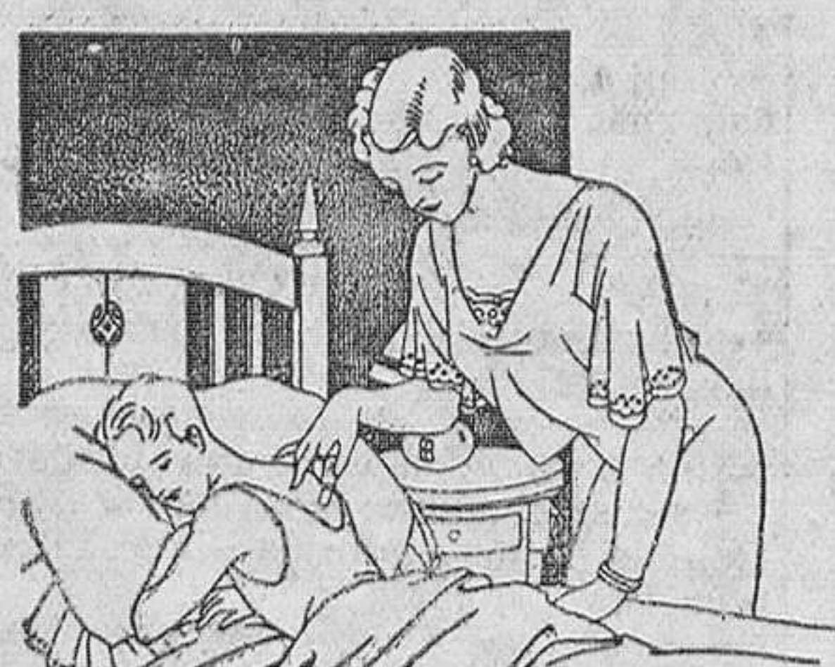
Resfríos - Asma - Pleuresias Congestión pulmonar