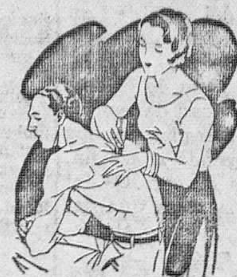
Artrismo Dolores de muñeca y brazos Dolores de espalda y riñones

El LAPIZ TERMOSAN se vende en todas las Farmacias y Centros de Específicos Tubo grande; 4.45 ptas. — Tubo pequeño; 3.— ptas., timbres incluidos