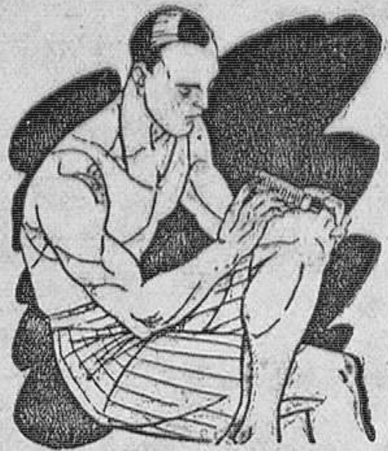
Reuma - Clásica Golpes

Preparado en forma de una barrita de facilísimo empleo. Se aplica rápidamente tal como se presenta y sin tener que ensuciar-se las manos.