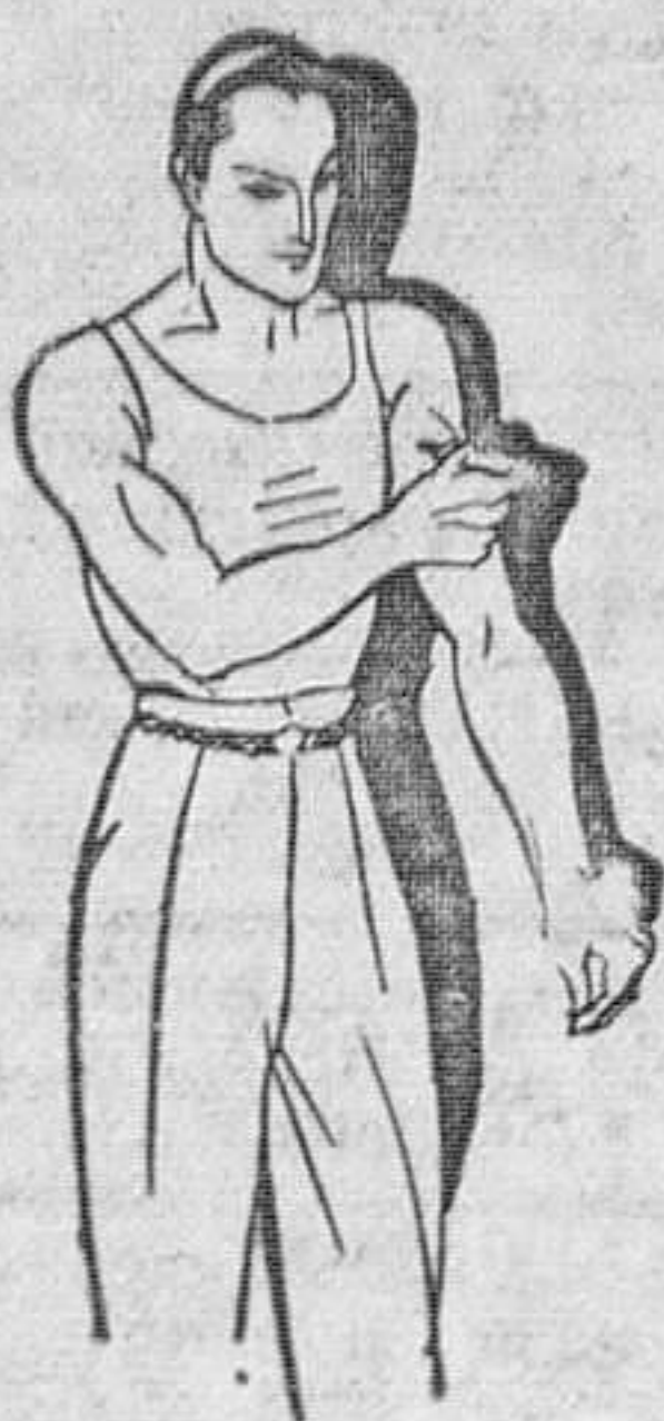
Fatiga muscular Golpes-Torceduras