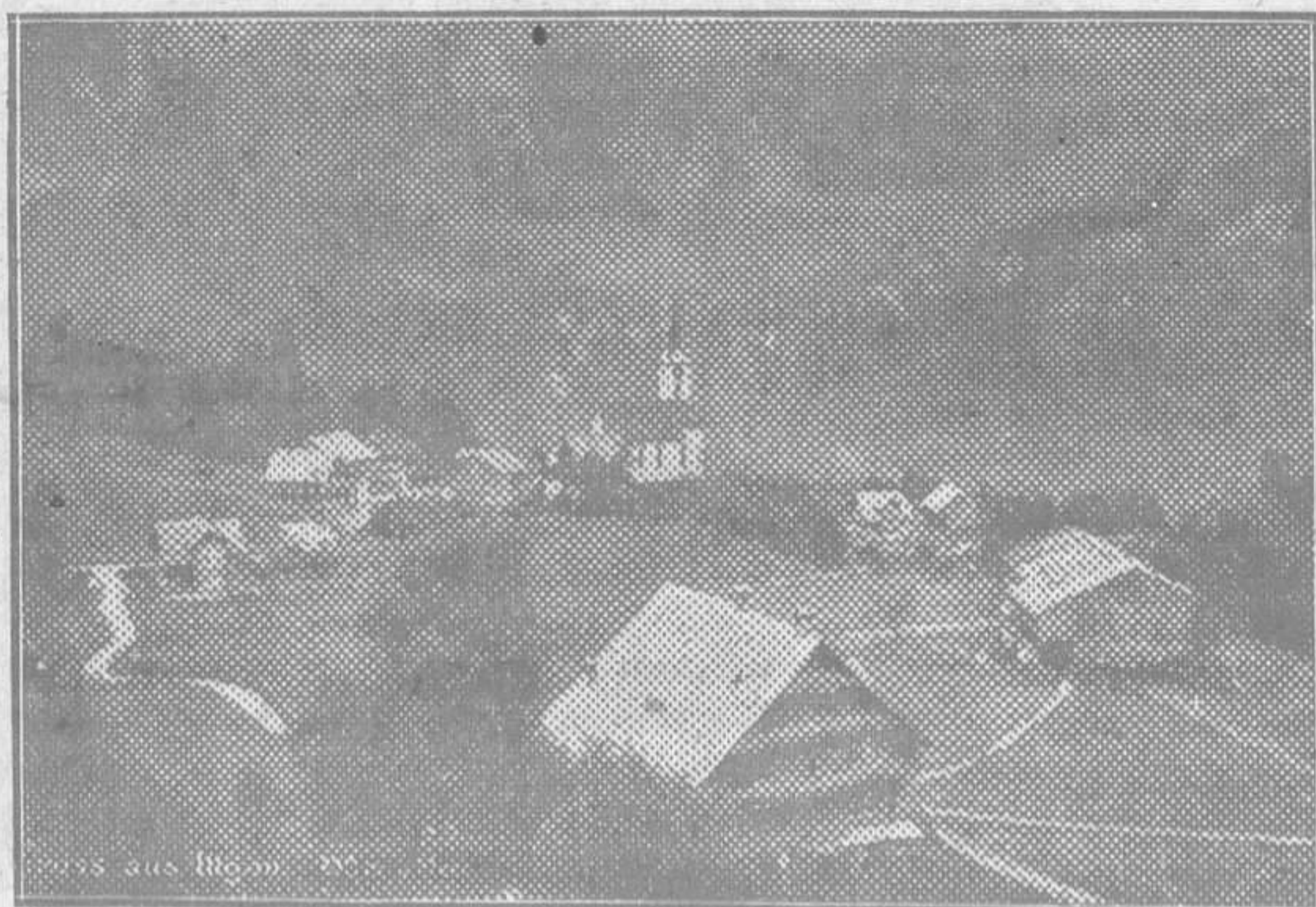
Illgau, aldeita en las montañas de Schwyz, donde la comisión de Asturias ha adquirido algunos ejemplares

En Austria, este Seguro está unido al de enfermedad, pagando los obreros los dos tercios de la cuota y el patrono el resto. En el Japón, el patrono y el obrero pagan por separado el importe de la cuota, estando también unido al de enfermedad. En Italia se concede un subsidio de 100 liras por alumbramiento, pagando de la cuota tres liras la obre-