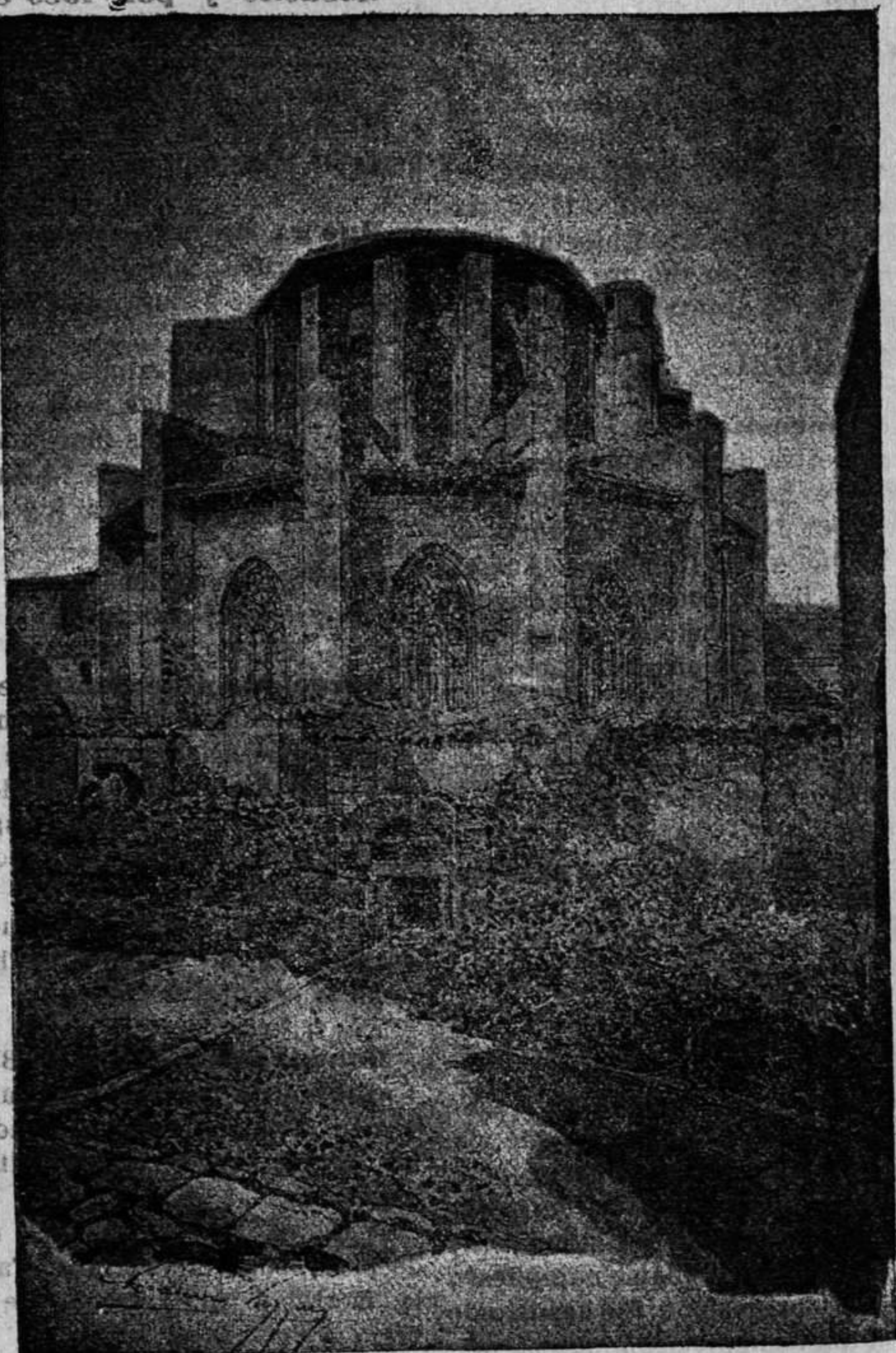
GERONA.—Álside de la Catedral

Revista de mercados —Escriben de Zaragoza, que el resultado de la vendimia no ha podido ser mas deplorable bajo el punto de vista de la cantidad pues aun en lo no apedreado sólo ha habido sobre