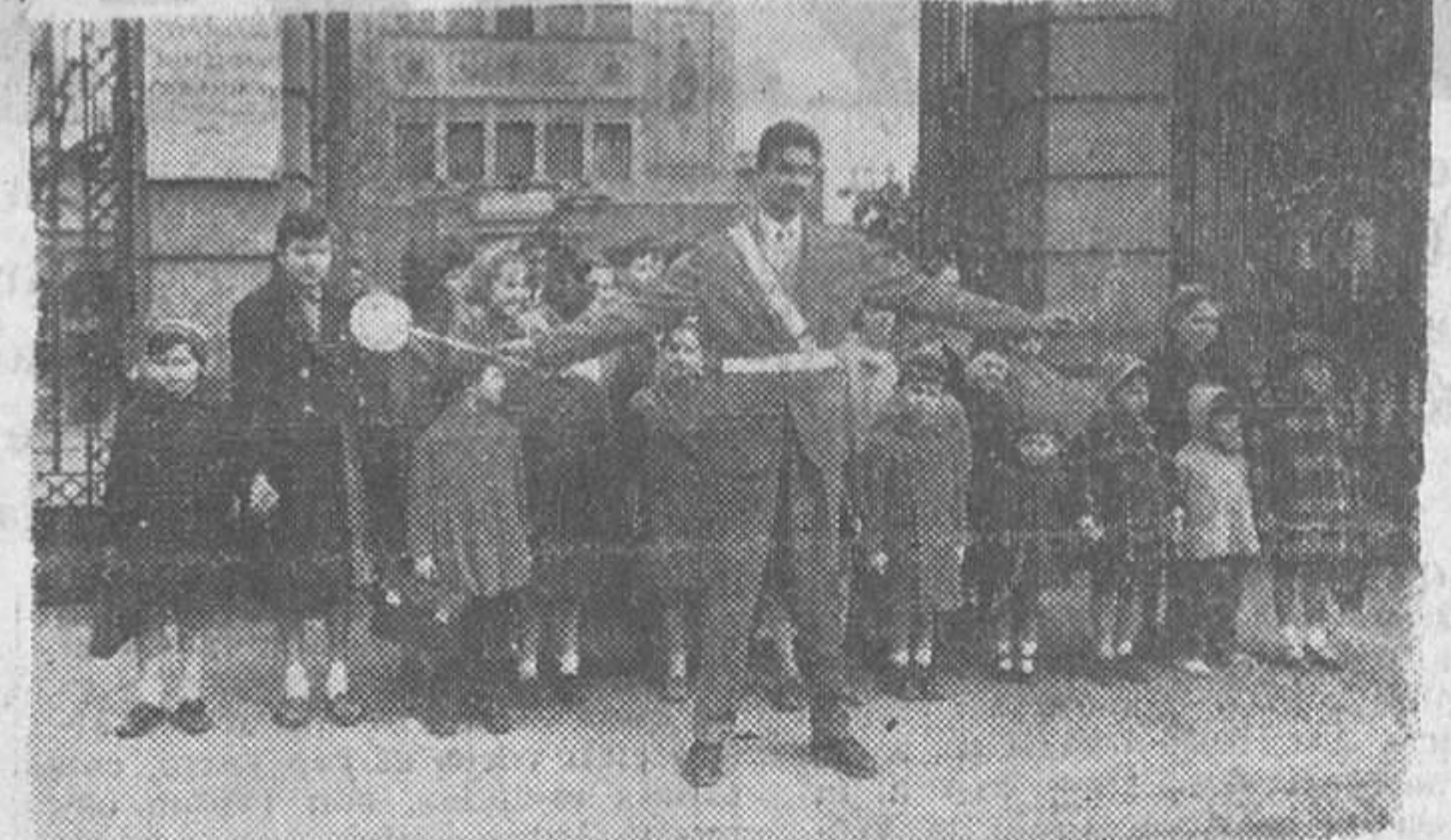
Siguiendo las orientaciones del R.A.C. de Cataluña, en una escuela barcelonesa se inicia a los escolares en el conocimiento de los preceptos contenidos en la nueva Cartilla de Circulación.