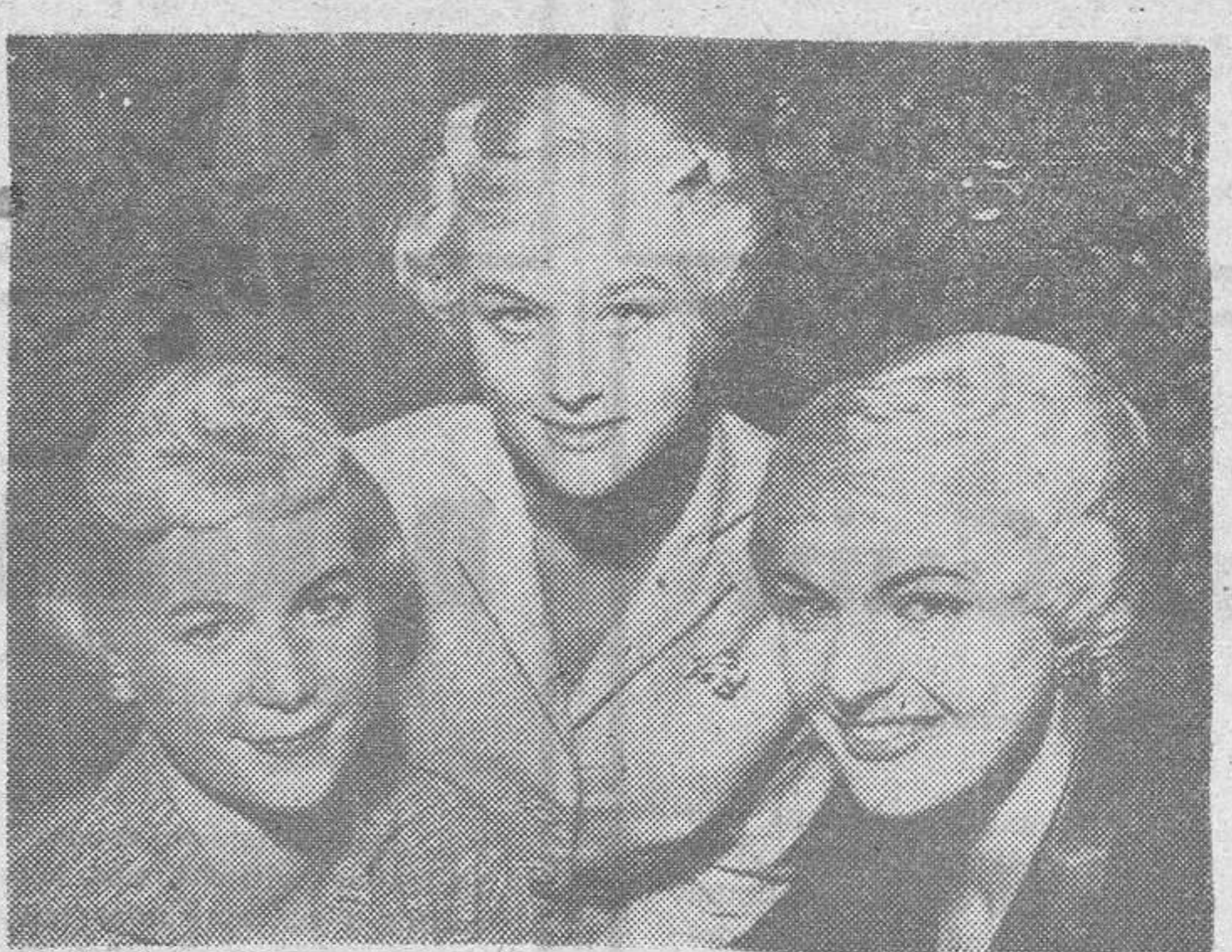
Londres.— Estos tres estilos de peinado para el próximo otoño han sido presentados por un peluquero austriaco en Londres