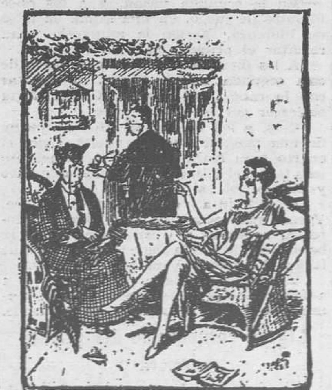
CONFIDENCIA DE FAMILIA

Alicante, 17. — Debutó anoche, en el teatro Principal, la compañía de Margarita Xirgu, con la obra Más fuerte que el amor , de Benavente. La presentación de la compañía resultó un éxito. Mañana, lunes, estrenará La Novela , de los Quintero.