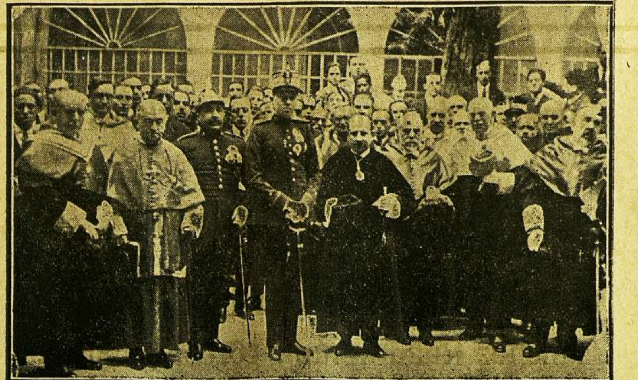
Su Alteza Real el Príncipe en el Patio de la Universidad con las autoridades académicas.