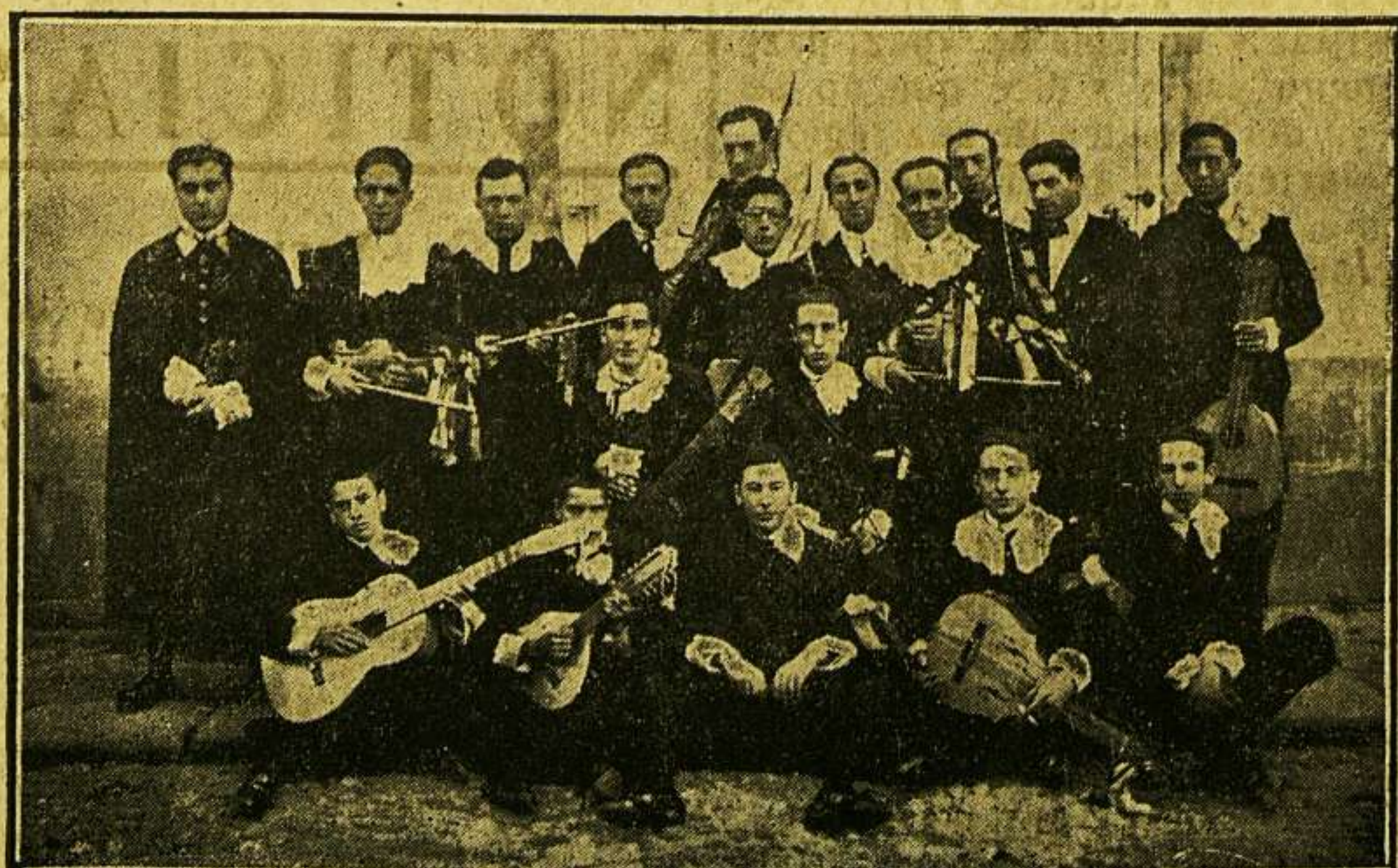
La estudiantina que tomó parte en la función de gala celebrada en el Teatro Bretón