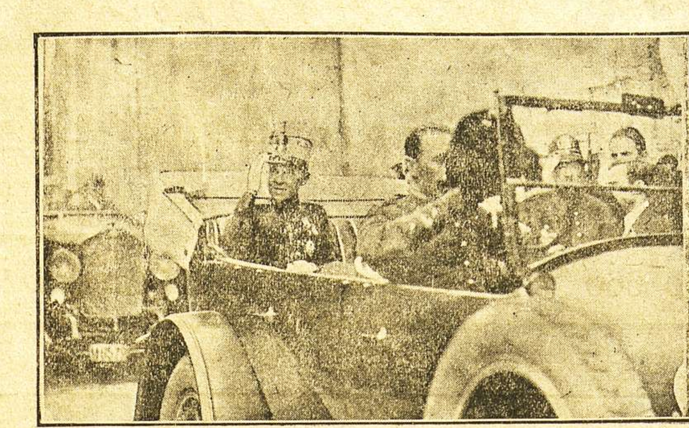
Su A treza saludando al pueblo que le a limba entus... (The caption is partially obscured and difficult to read fully, but it seems to describe the scene in the photo.)

A continuación, y terminada ya la ceremonia de la bendición, los Somatenes forman en columna de honor con la bandera al frente, con el abanderado don Cándido R. Maga-