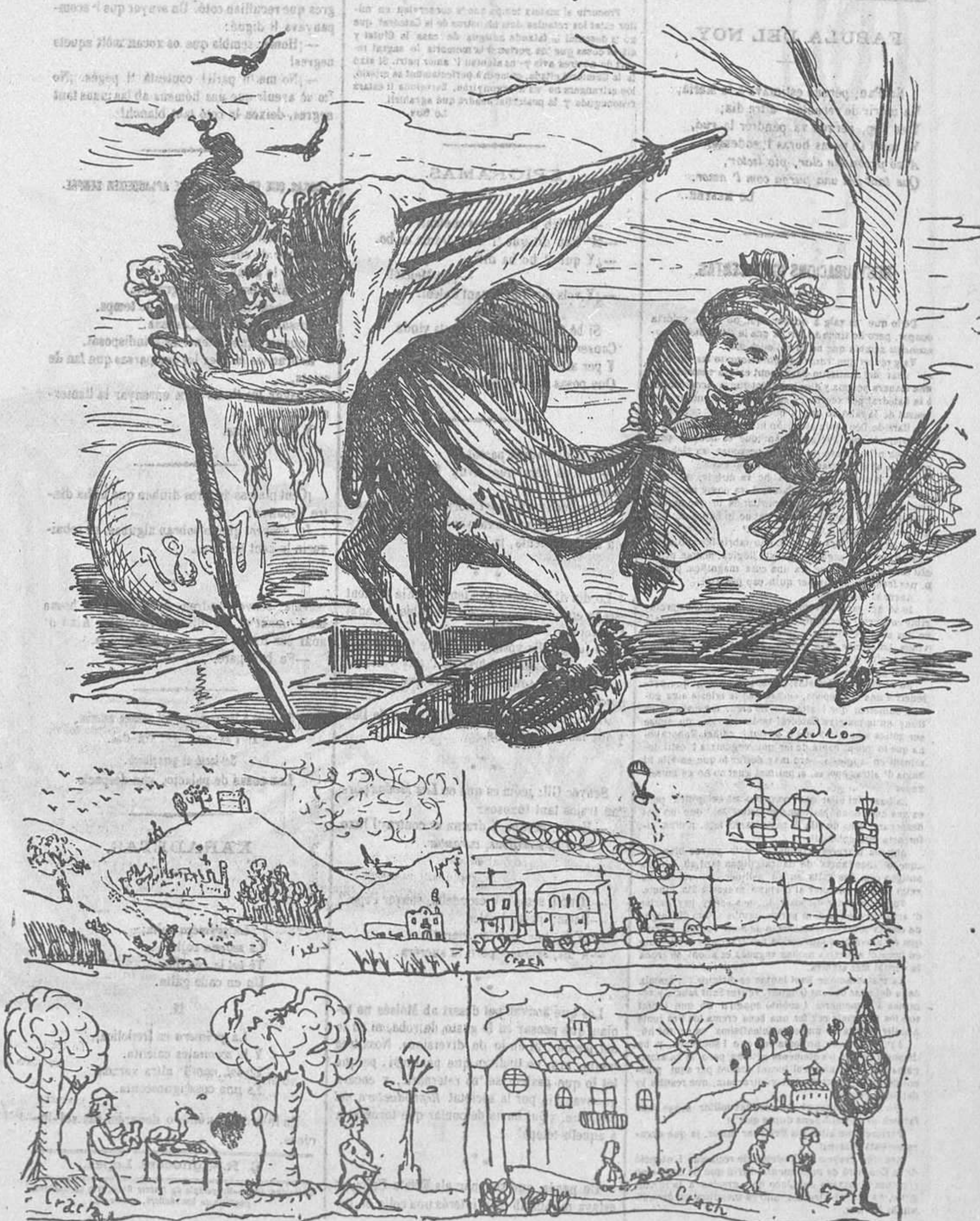
Dibuixos que lo Noy envia a la Exposició de Paris.