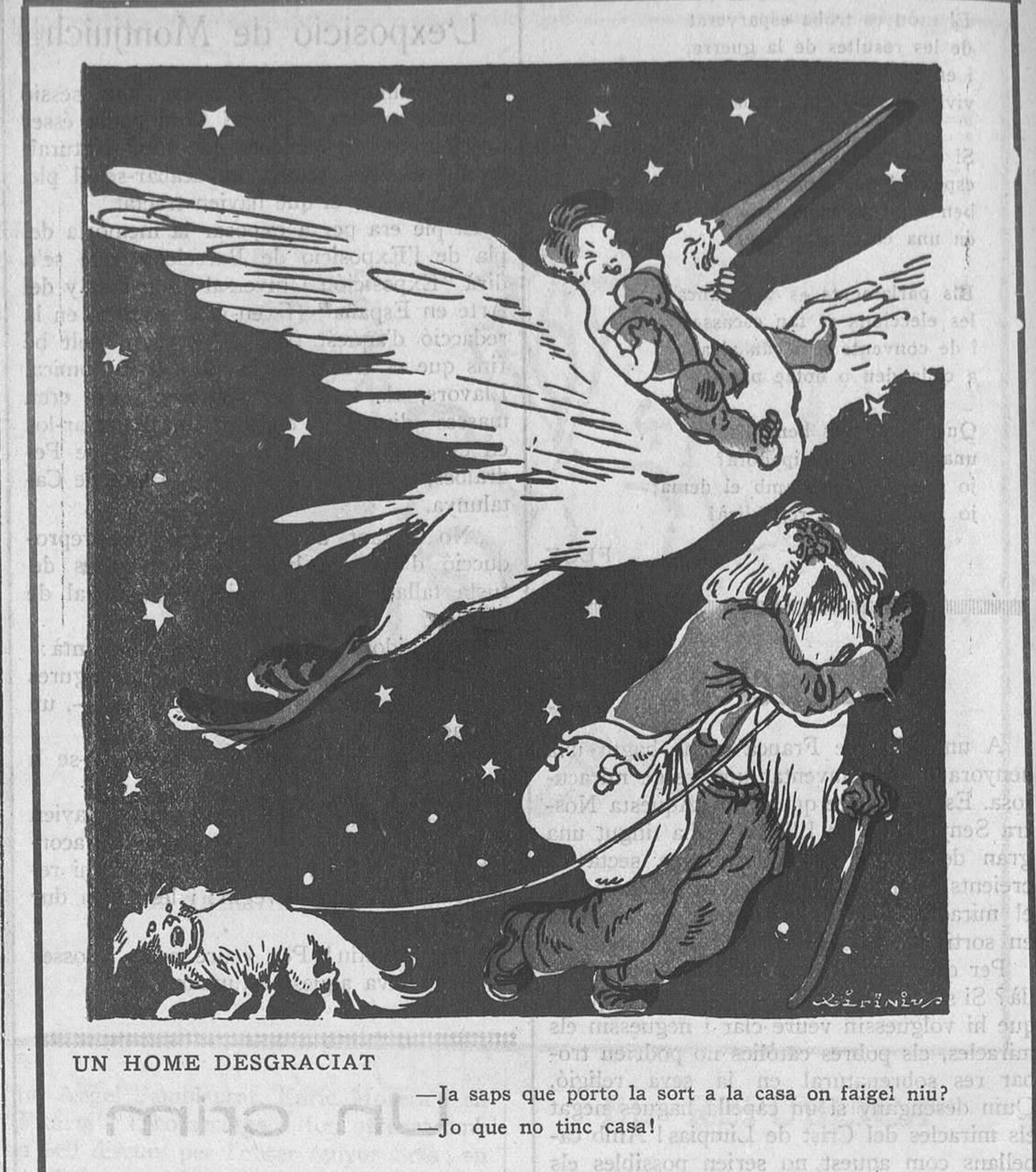
UN HOME DESGRACIAT —Ja saps que porto la sort a la casa on faig el niu? —Jo que no tinc casa!

Cridem l'atenció al senyor governador perquè posi a ratlla a certs pirates "teatreros" que roben miserablement els diners del públic que tolera aitals pirateries.