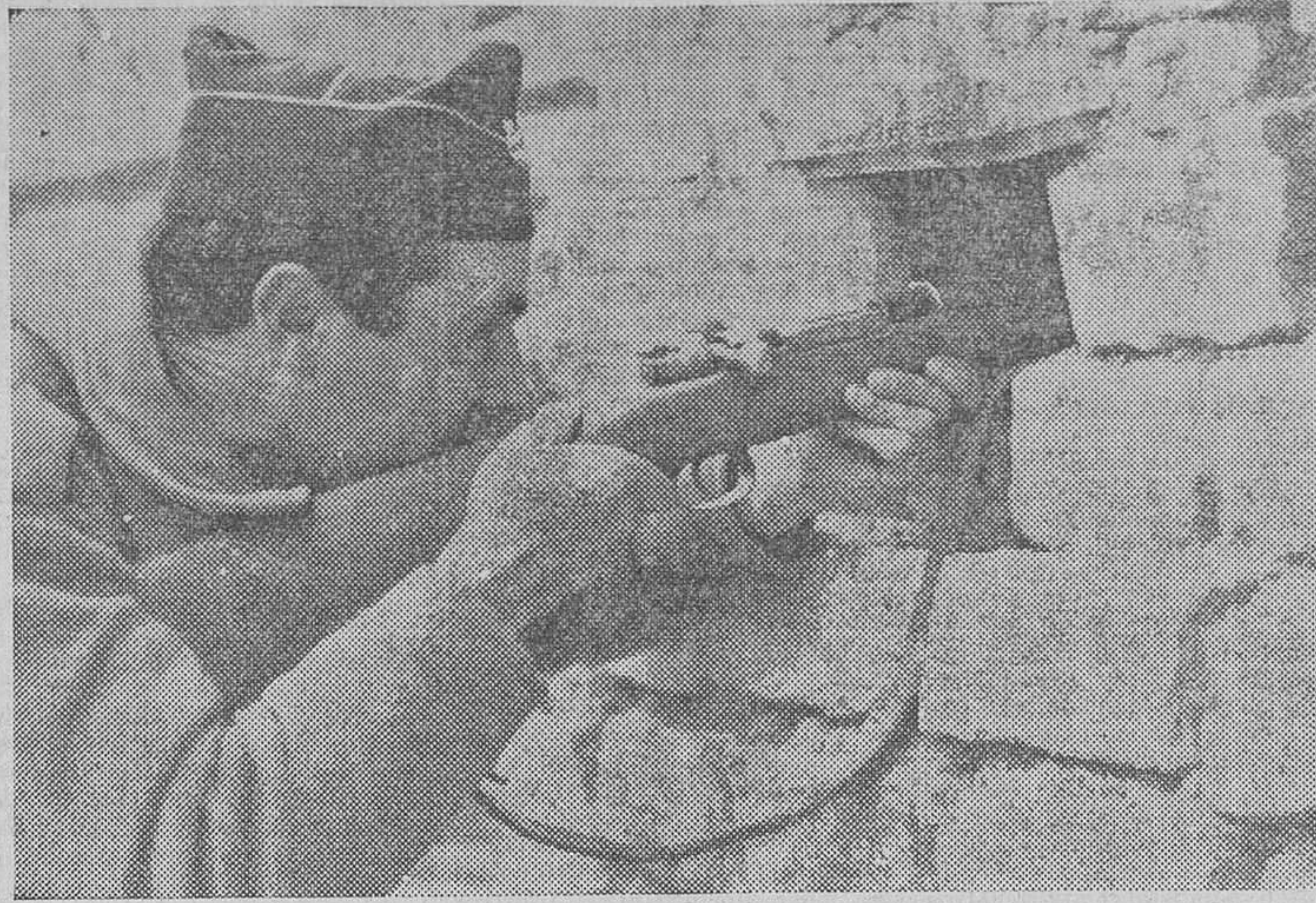
Un heroico miliciano, y como él hay millares, aguarda, tras el parapeto, la orden de disparar contra el enemigo que acecha

—¿Y cómo explica usted—preguntó el fiscal—su presencia en los actos izquierdistas?