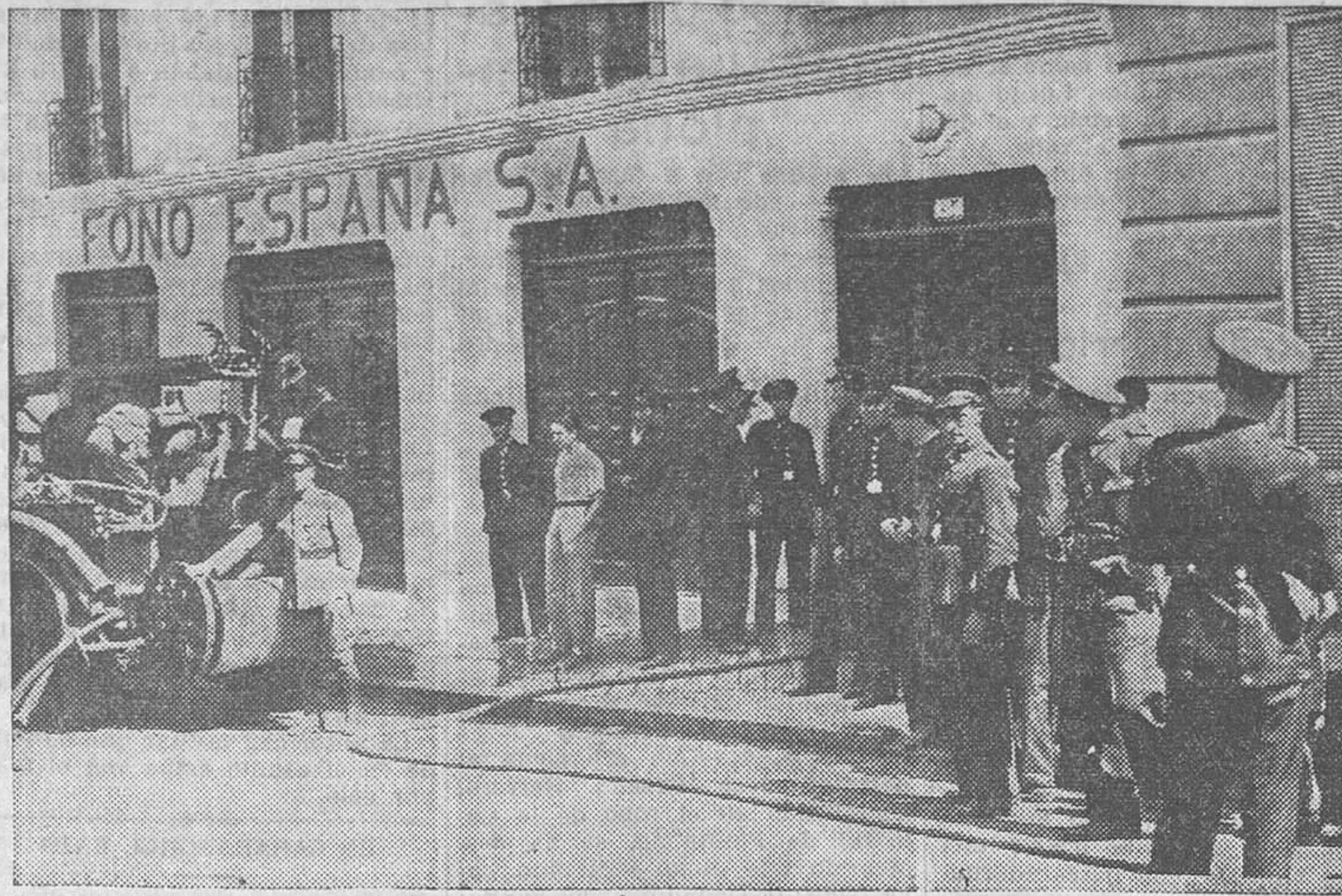
Exterior de la casa de películas donde ayer mañana se declaró un incendio