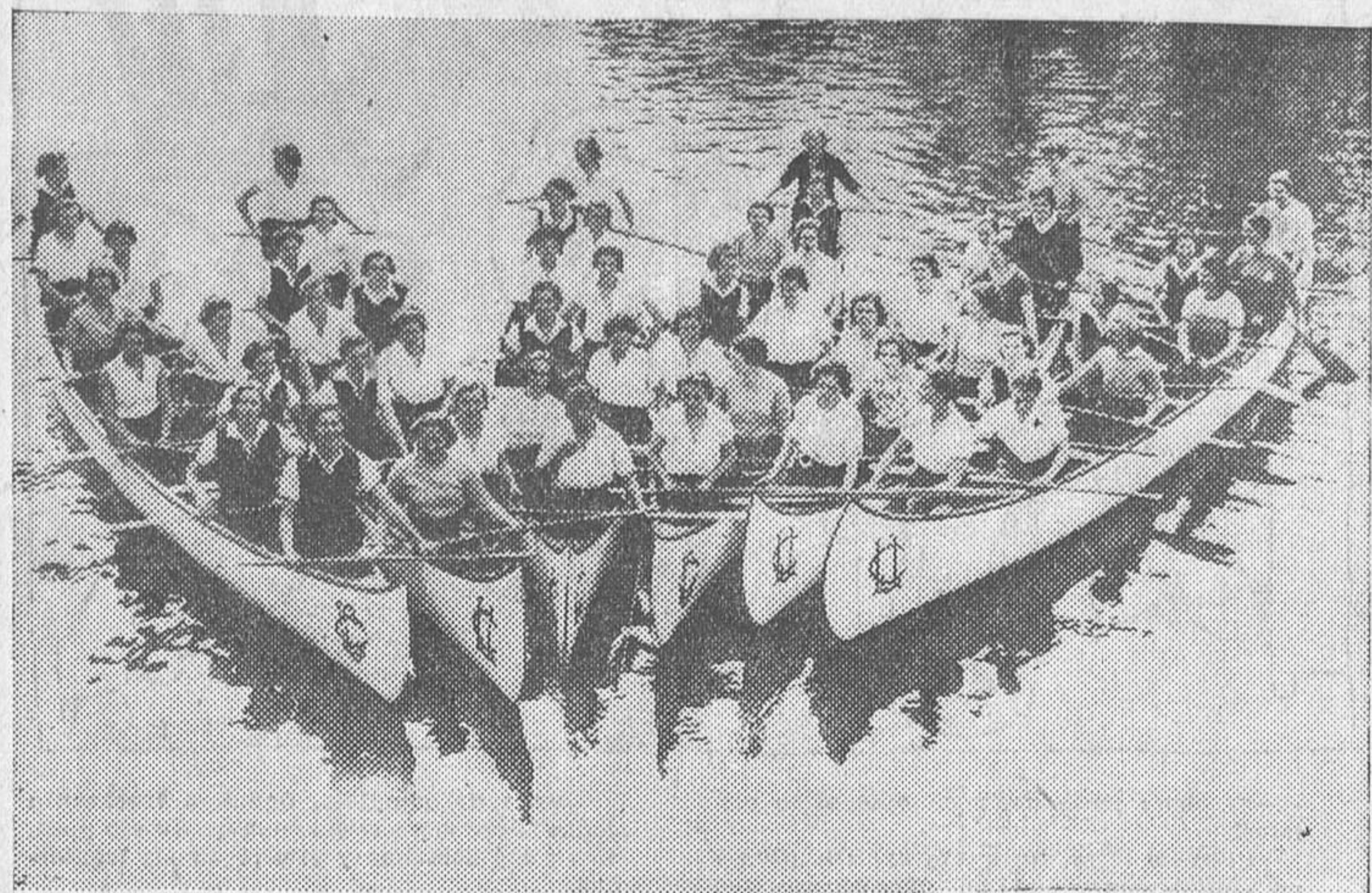
Las muchachas de Auburndale (Norteamérica) se divierten haciendo deporte con las canoas de guerra que usaron los con-temporáneos de Hiawatha