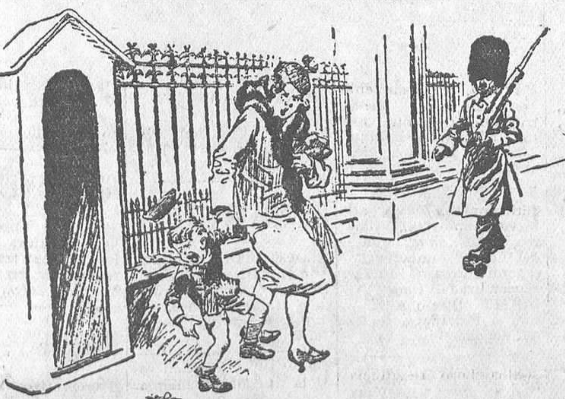
—Yo quiero ver salir al rey, mamá. —Vamos, niño: el rey no saldrá hoy. —¿Por qué no saldrá hoy, mamá? —Porque lo mando yo, y se acabó!