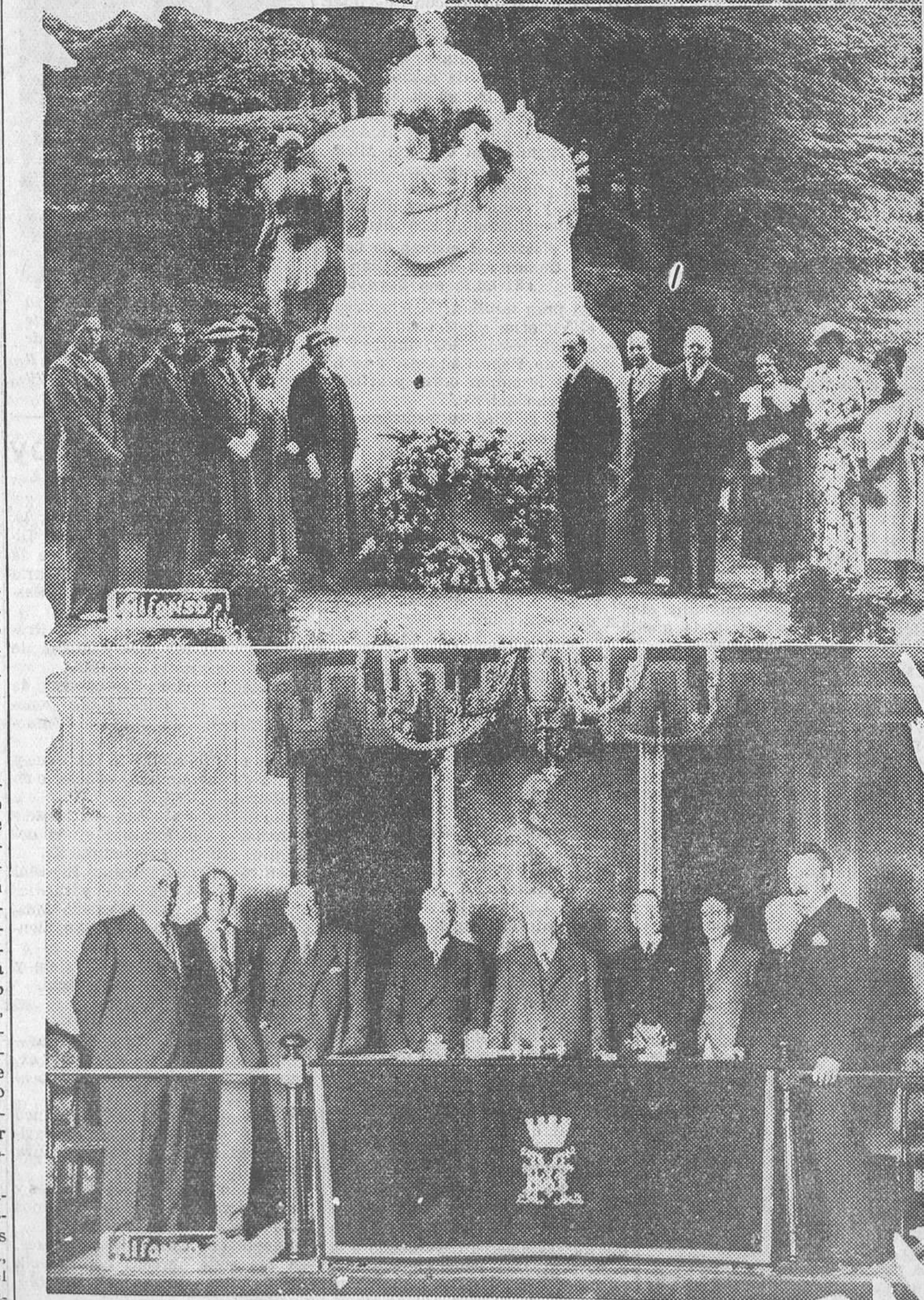
Arriba: Los embajadores de los Estados Unidos y la Comisión del Toledo yanqui que ha visitado nuestro Toledo, ante el monumento a Concepción Arenal, donde colocaron una corona de flores.—Abajo: Recepción del doctor Slöcker en la Económica de Amigos del País, donde pronunció una conferencia

La ilustre dama americana Mrs. Grave Peterson, que se encuentra en nuestro país con motivo de la visita a Toledo, primera mujer a quien la República de España ha concedido la cruz de Isabel la Católica