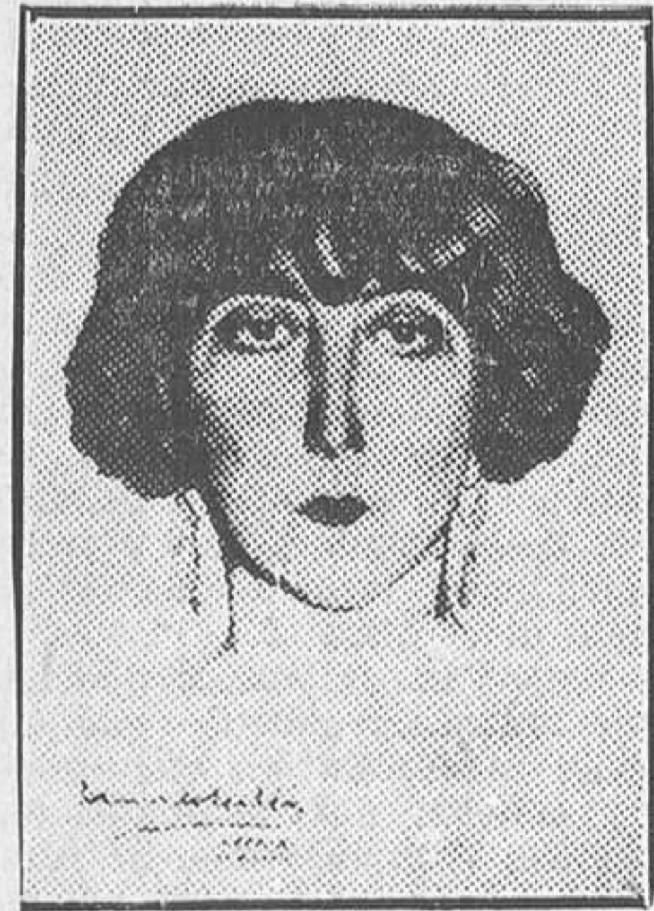
La insigne escritora Concha Espina

Concha Espina es poeta, y basta. El sentimiento lírico le pertenece plenamente. Acaso su verso no brille por la calidad musical exterior, que muchas veces es cuestión de paciencia y ejercicio. Ella no se ha dedicado a hacer arpegios y escalas sobre la clave del verso; no ha hecho de ese don divino un entretenimiento ni menos una profesión, reservando únicamente su facultad cantora para solemnizar momentos extraordinarios de su vida, y siempre en un tono íntimo y recatado, que borra perspectivas de público. (El verso en ese sentido es como una oración a Dios o a uno mismo, no menos misterioso que Dios.) Su lírica excluye la oda y el epinicio, y aun esa suerte de prosa rimada que hasta nuestro lirismo más puro, Antonio Machado, ha admitido en su obra. (Recuérdense sus exhor-