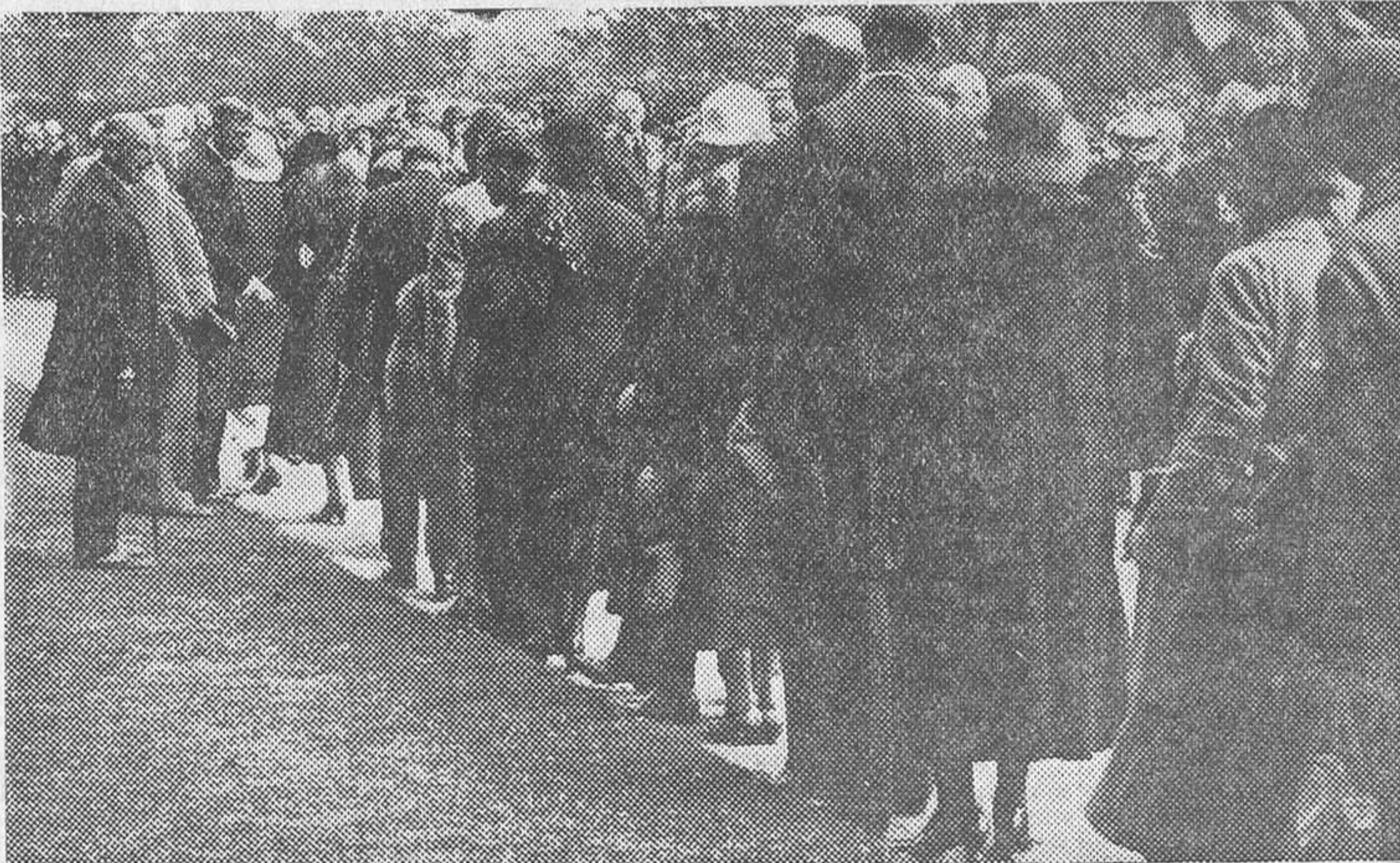
El príncipe de Gales estrechando la mano de los ex combatientes ingleses, que, acompañados de sus familias, van a visitar los que fueron campos de batalla en Francia y en Bélgica