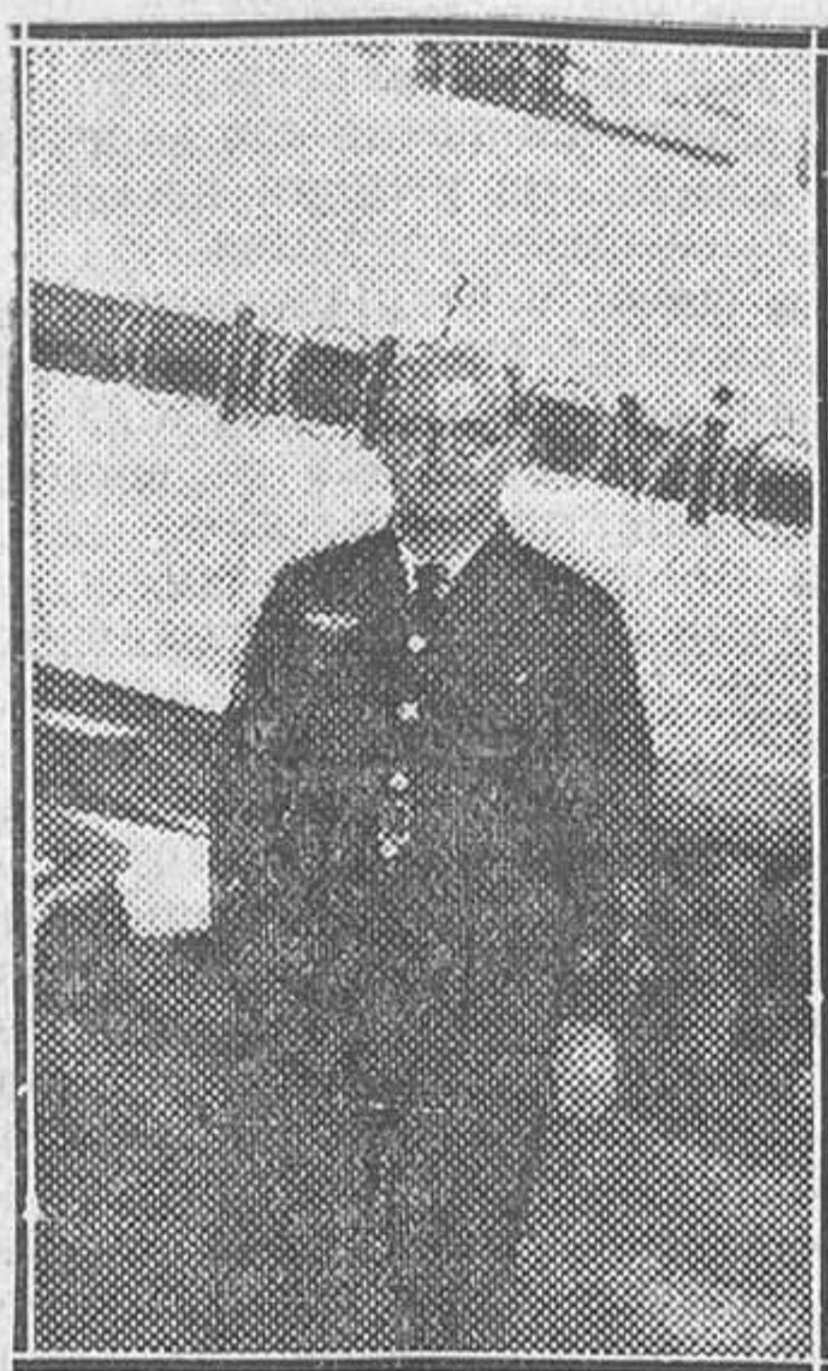
El capitán D. Mariano Barberán y Tros

Esta madrugada ha hecho un año que del aeródromo de Tablada, en Sevilla, el capitán Mariano Barberán y el teniente Joaquín Collar, de la Aviación española, emprendieron su glorioso y trágico vuelo a América. Con este vuelo, España se colocó en la primera fila de las hazañas mundiales de aviación.