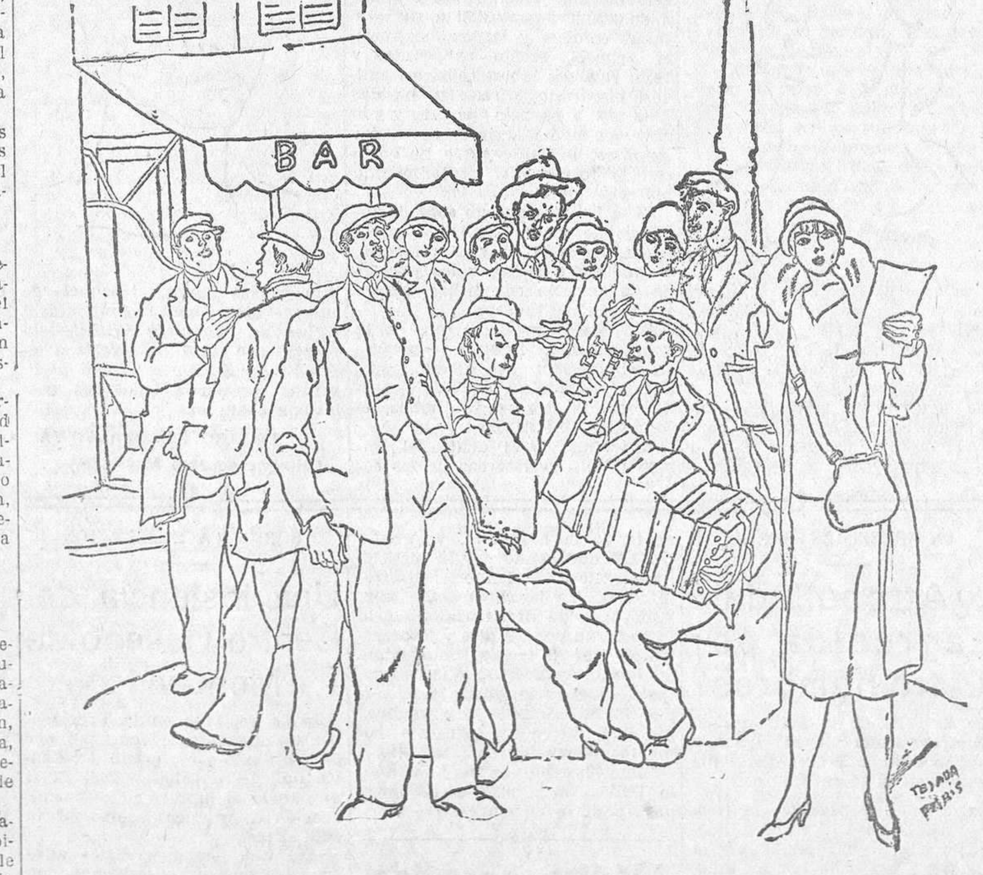
(Dibujo de Carlos S. de Tejada)

(1) Véanse los números de LA LIBERTAD correspondientes a los días 17 y 30 de Junio, 13 de Julio, 1 y 22 de Agosto, 11 y 30 de Octubre, 2 y 12 de Diciembre de 1926; 9 y 22 de Enero, 2 y 30 de Marzo, 23 de Abril, 12 y 26 de Mayo, 3 y 25 de Junio, 6, 13, 21 y 27 de Julio y 3, 10, 19 y 25 de Agosto de 1927.