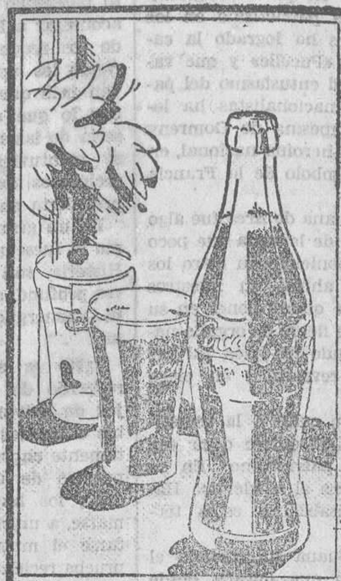
En esta bebida encontrará usted un sabor nuevo y diferente a todos los conocidos