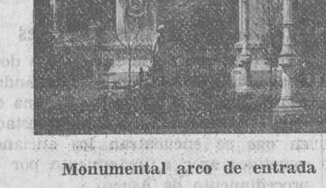
Monumental arco de entrada a la Exposición regional de 1909

Al evocar el fausto suceso, precisamente en los momentos en que Barcelona y Sevilla celebran sus espléndidas Exposiciones, no podemos por menos de dedicar un cariñoso re-