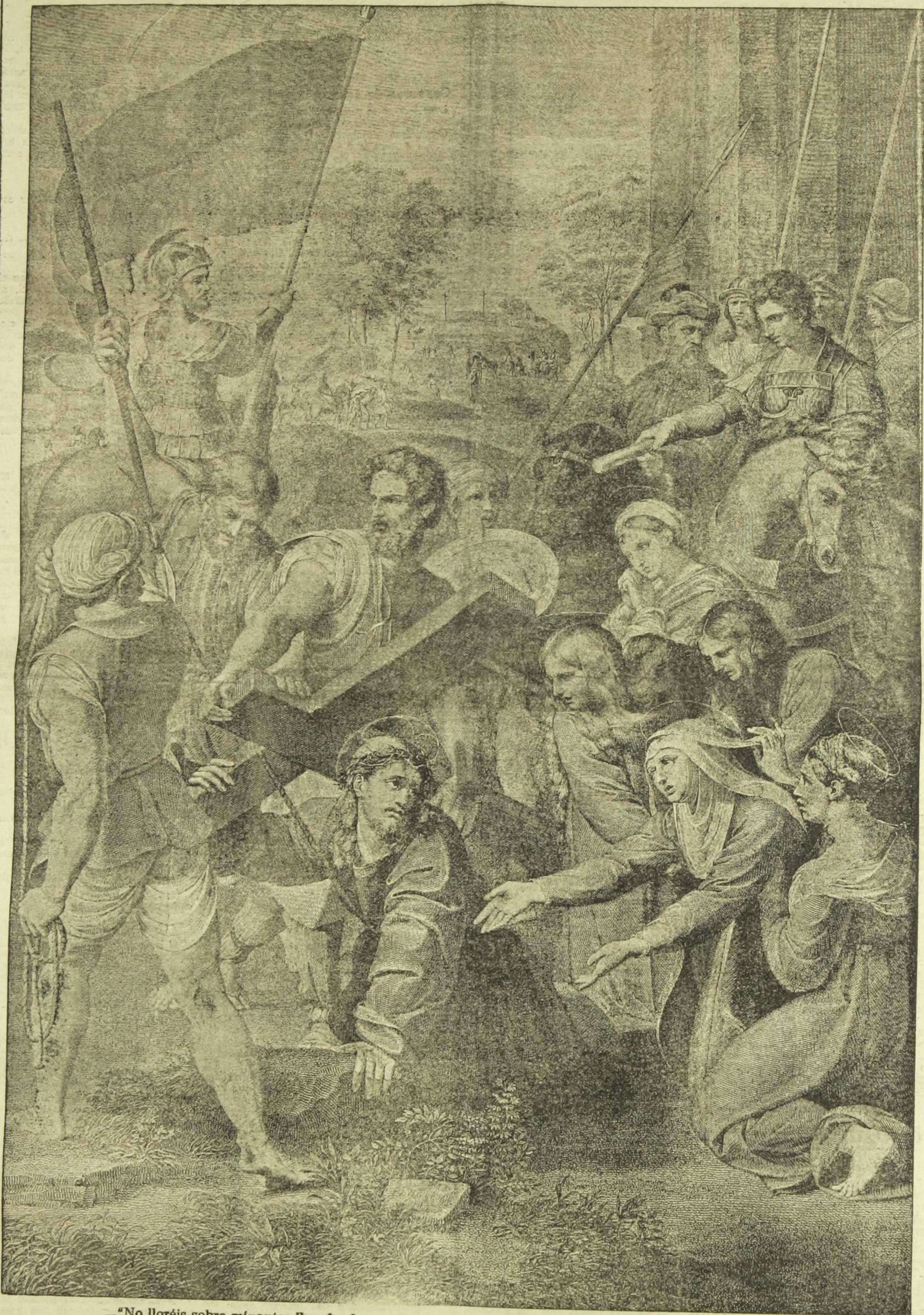
—'No lloréis sobre mí; antes llorad sobre vosotros mismas y sobre vuestros hijos'. (San Lucas, cap. XXIII). Hermosísimo cuadro conocido por 'El Pasmo de Sicilia', pintado por Rafael Sanzio, y que es una de las más preciadas joyas del Museo del Prado de Madrid.