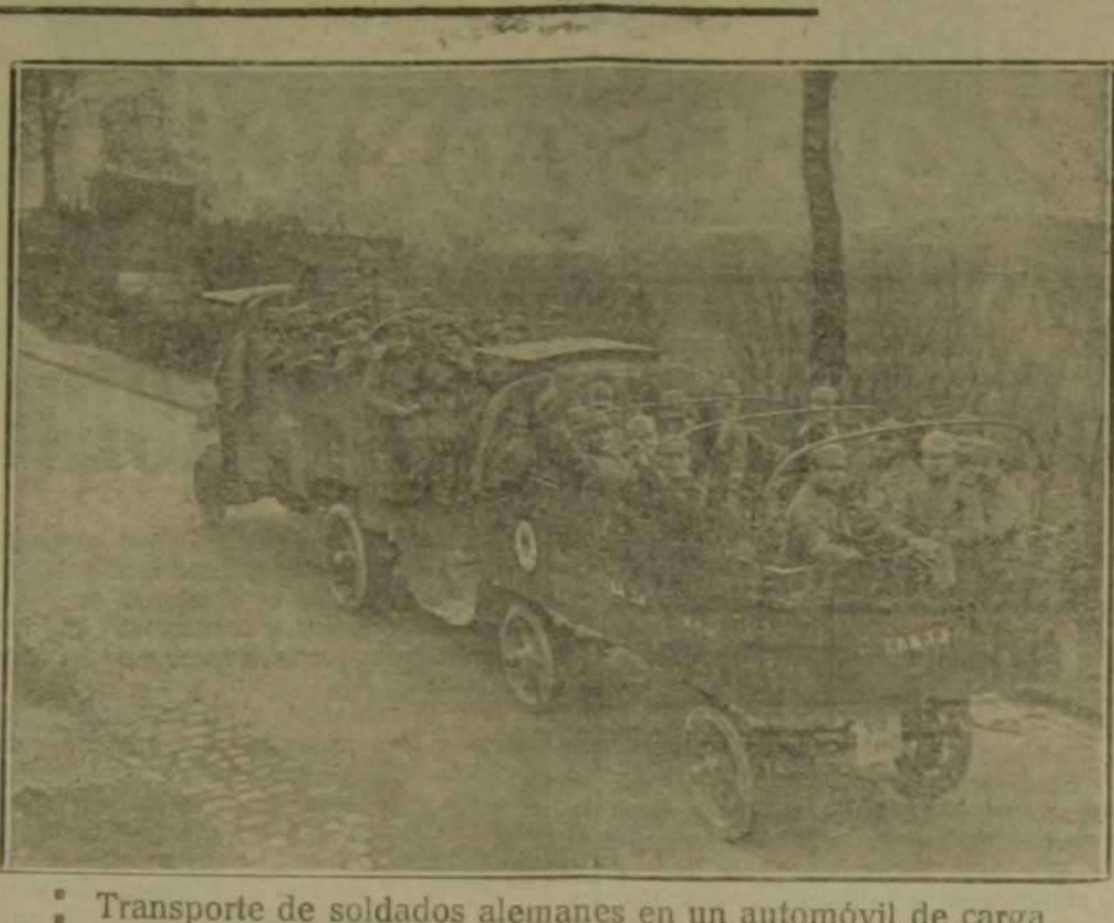
Transporte de soldados alemanes en un automóvil de carga