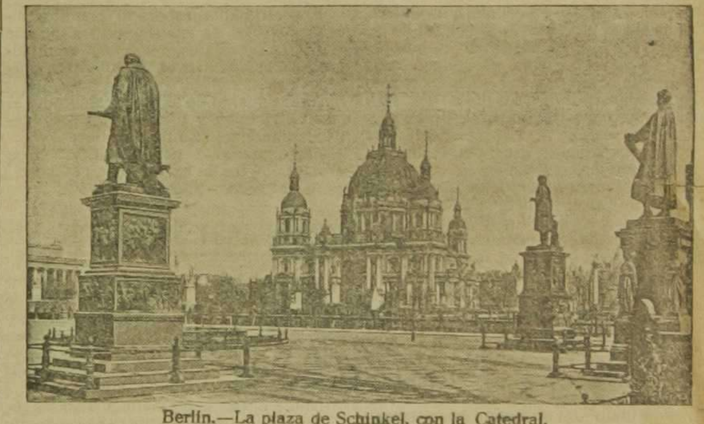
Berlín.—La plaza de Schinkel, con la Catedral.

La ambición empujó siempre al capitán corso, quien una vez derribado el Consulado con su teatral golpe de Estado, erigió en dictador suya y se obsesiona con la teoría del gran imperio que a toda costa quiere implantar. La fortuna, que como decía el viejo Mauricio de Sajonia, es veleidosa y da sus favores al más joven, le protegió a manos llenas, y así, casi sin ninguna previsión y cálculo, las águilas imperiales arrollaron cuanto a su paso se oponía, impulsadas siempre por la sed ilimitada de gloria de su general. De ese modo pudo, en tan poco tiempo, traspasar las fronteras del mapa político de Europa y crear a su antro Estados para repartir entre deudos y amigos donde poder lucir abigarrados y fantasistas uniformes. Y sucedió lo inevitable; pues como aquella carrera triunfal no obedecía a un plan madurado en estudios y conferencias