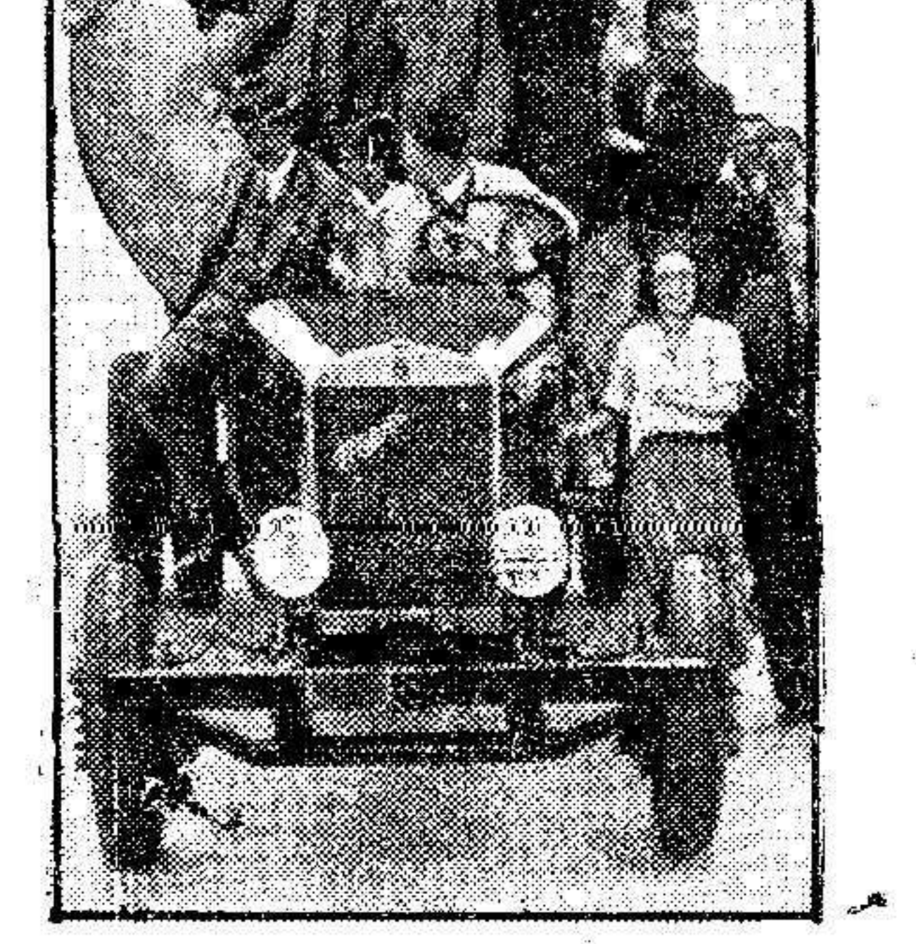
Que efectuó el viaje a la stratosfera, exhibe su famosa canastilla sobre una camion por las calles de Bruselas.