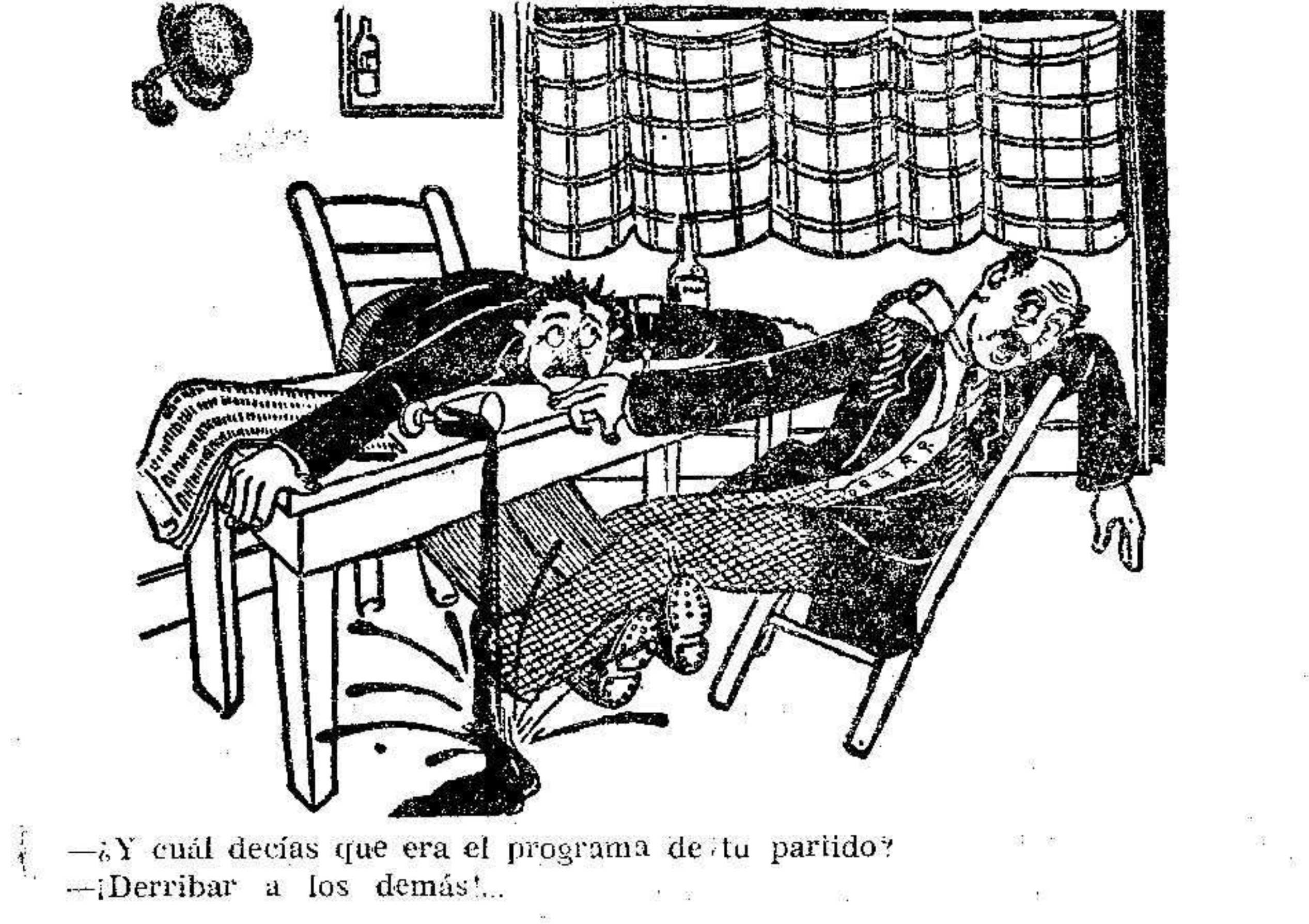
—Y cuál decías que era el programa de tu partido? —Derribar a los demás...