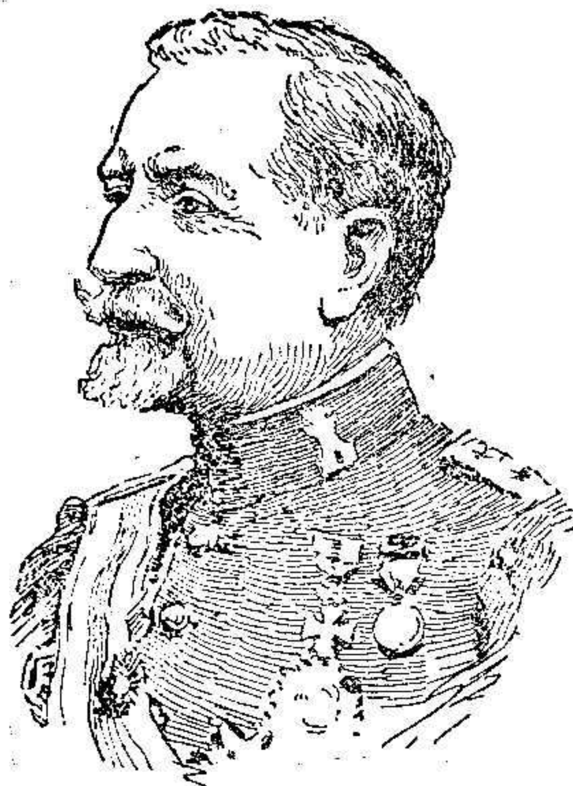
General Marvá, nuevo Presidente del Instituto Nacional de Provisión