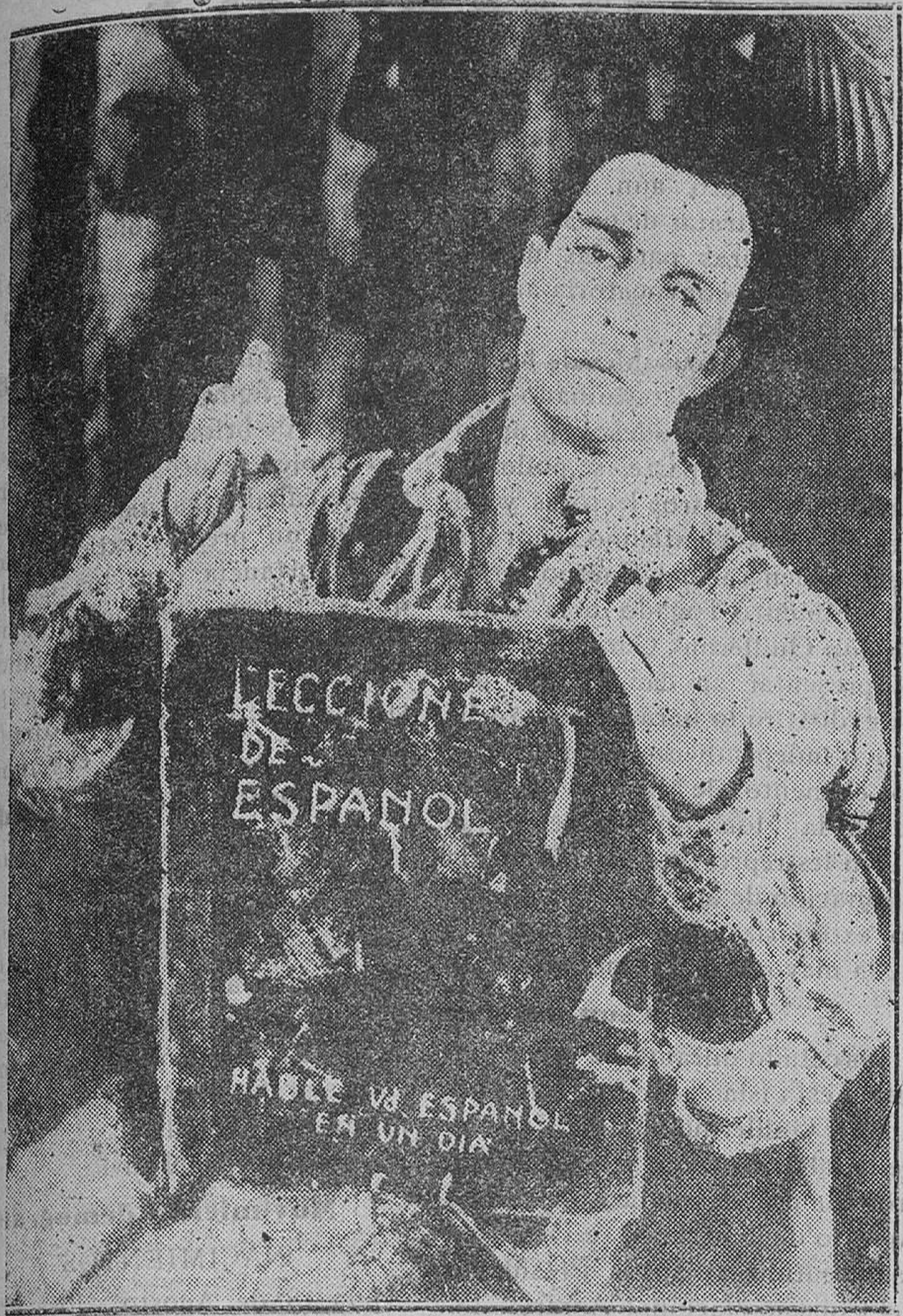
MADRID.—El famoso artista de cinematógrafo Bustos Keaton. (Pamplinas), que está en España y que llegó a Madrid de paso para Barcelona.—En esta foto se le ve luchando porque no puede aprender español rápidamente

Las huelgas que estos días se desarrollan en el Norte de Francia no tienen solamente interés local o nacional. Lo tienen internacional. El movimiento huelguista de la vecina república es para nuestros industriales y gobernantes una lección de cosas, que en más reducido círculo se ha dado también en España. Y es fácil se vuelva a dar, si un día se trata entre nosotros la implantación de ciertos seguros, como los que se implantan en Francia.