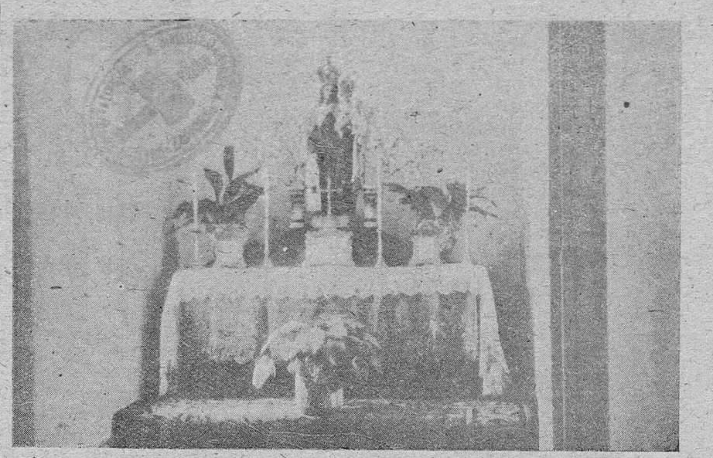
Capilla de la Obra

Siempre ha sido criterio sindical nada menos que llegar a la prestación gratuita de todos los servicios sanitarios, mediante la aportación protegida y proporcional respaldada por la economía del Sindicato respectivo.