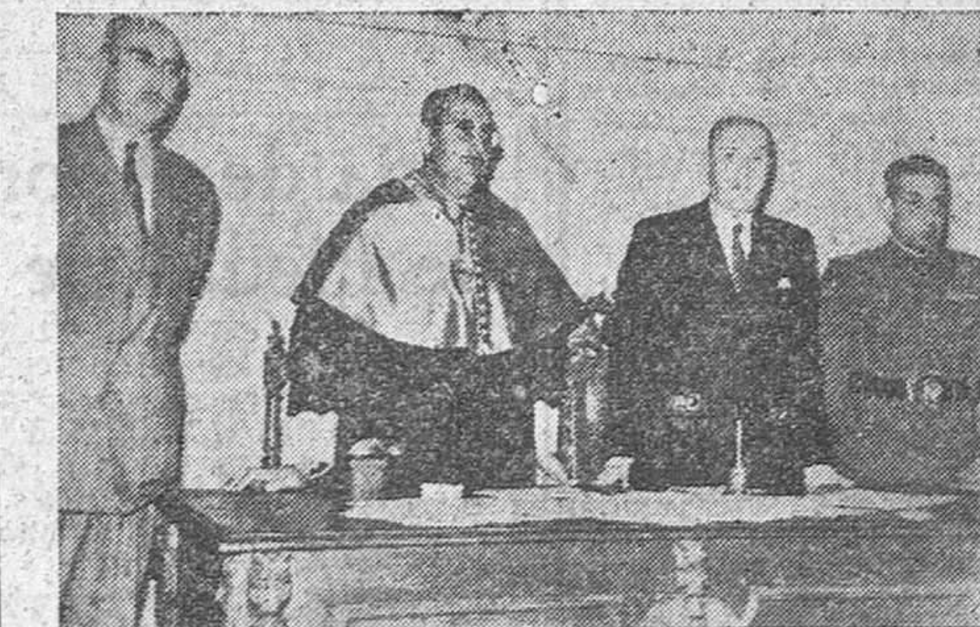
El gobernador civil declaró abierto el curso 1955-56.