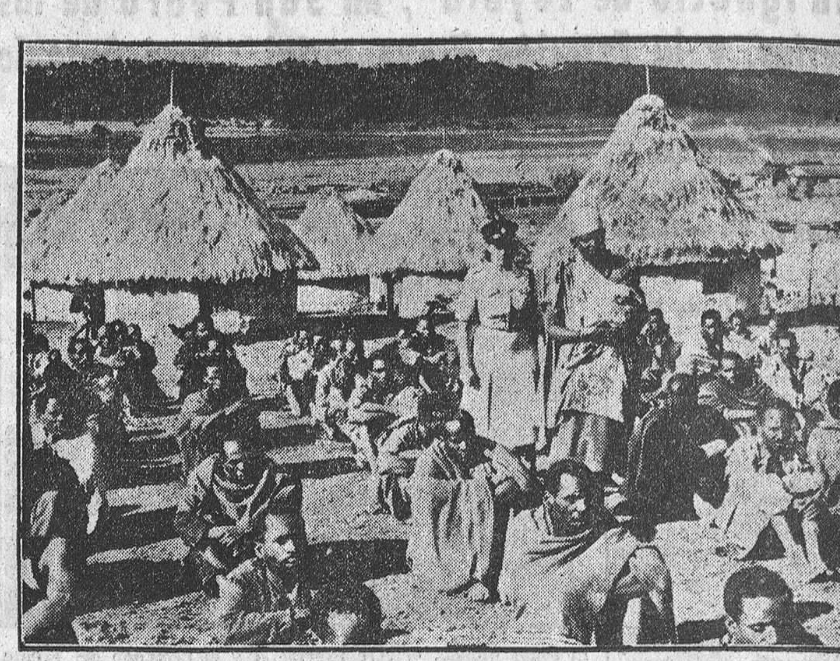
KENYA.—Esta mujer africana, con su hijo de pocos meses en brazos y acompañada de una señora policía, trata de identificar entre el grupo de detenidos por sospechosos de ser terroristas del Mau-Mau, a los asesinos de su esposo, que fue asesinado en un reciente ataque en el que perdieron la vida cerca de 140 kikuyos.