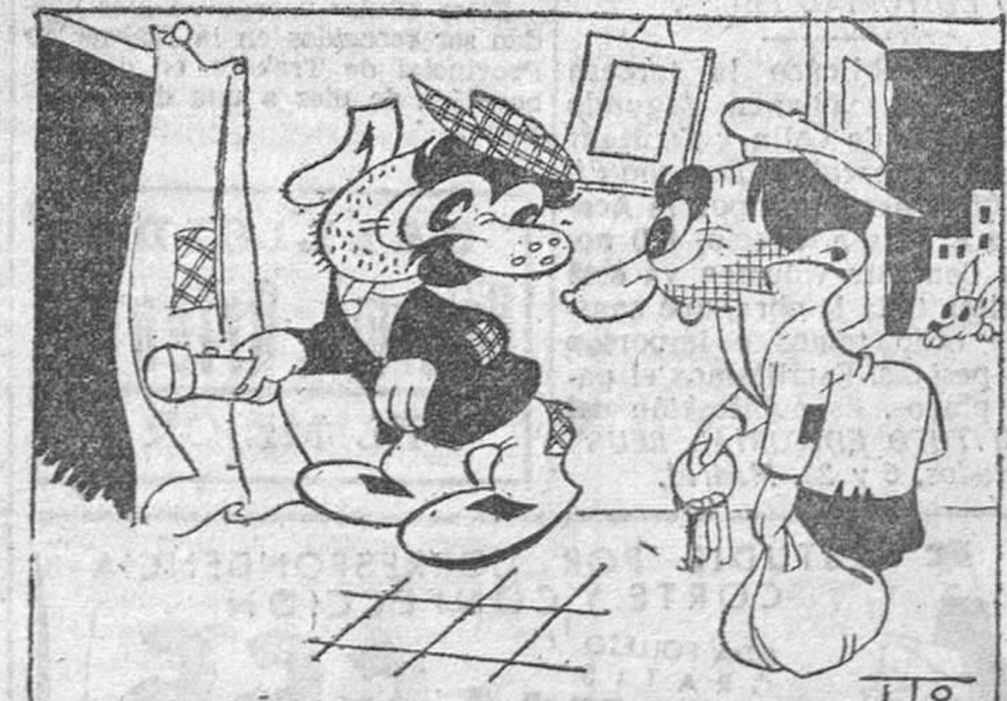
—Pero si así vive «el Chacki» —Pues, vámonos; sería un cargo de conciencia robar a un compañero.