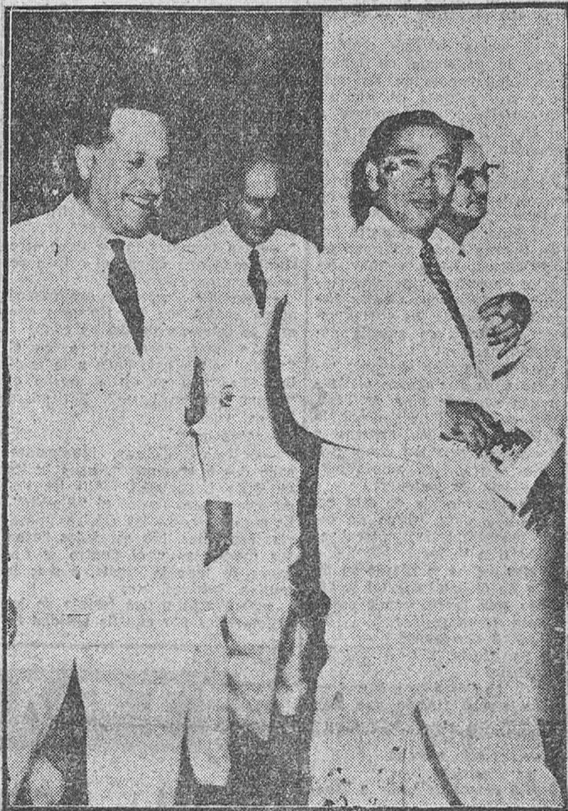
LA HABANA.—El Presidente Batista durante la visita, que duró dos horas, a la Exposición «Goya y el Grabado español», instalada en el Capitolio Nacional.

Batista visita la Exposición "Goya y el Grabado Español"