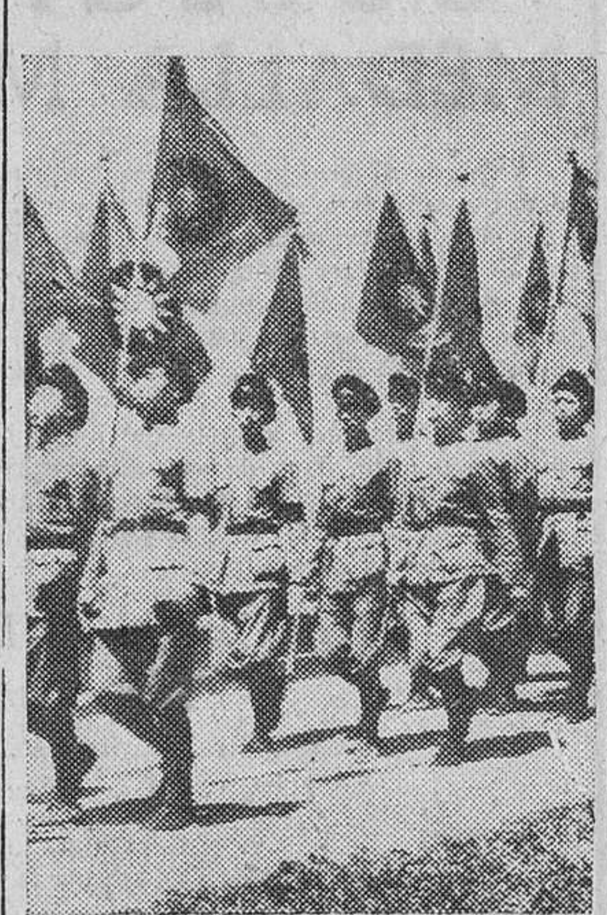
Una formación de cadetes chinos desfila con las banderas al viento por las calles de Chung King.

LA GUERRA CONTINUA Información en la pág. 4. a