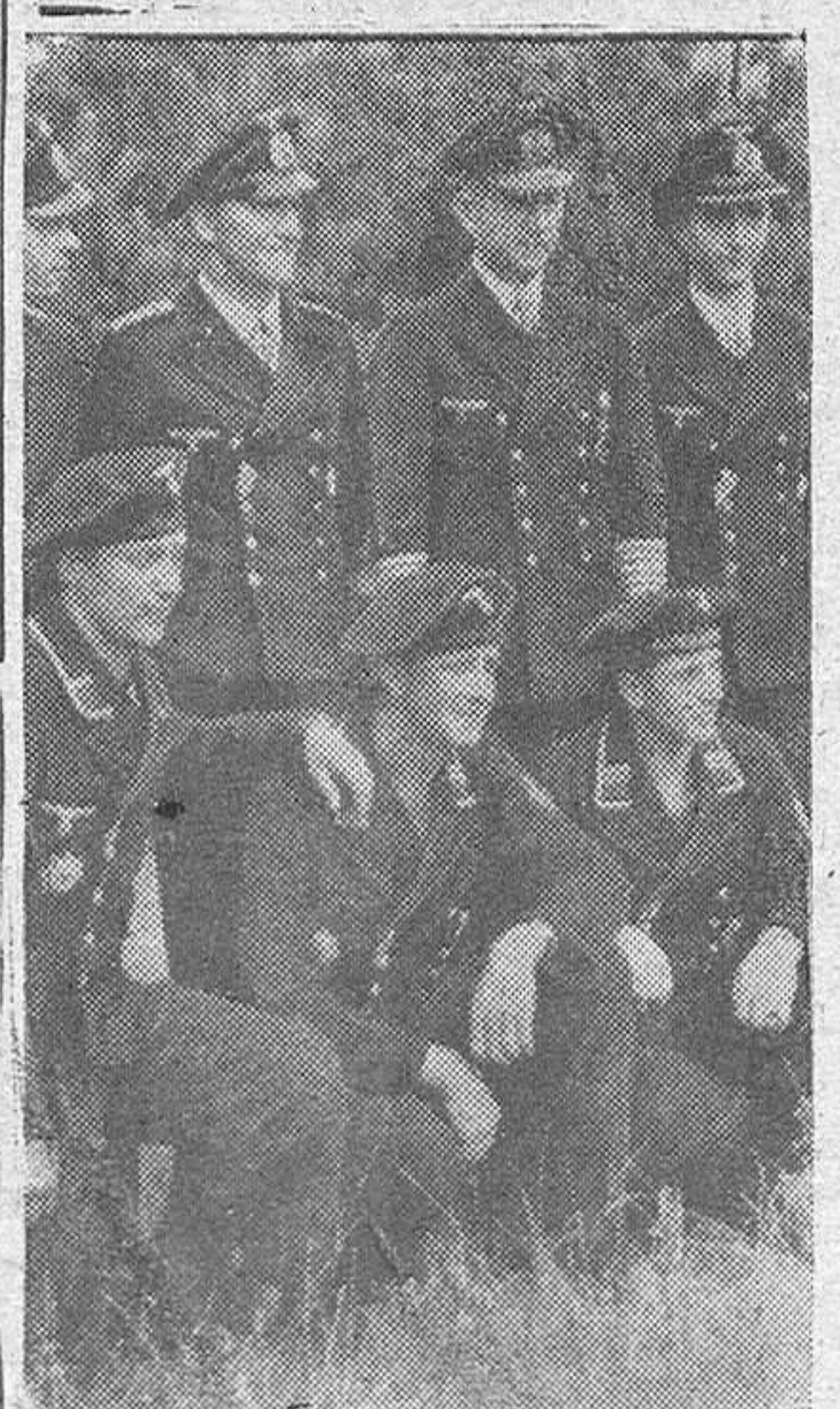
El jefe de la Marina del Reich, almirante Doenitz, ha recibido recientemente a varios tripulantes de las nuevas armas alemanas torpedos humanos y lanzas explosivas para imponerles altas condecoraciones otorgadas por el Führer. En la foto vemos a Doenitz rodeado de un grupo de marinos.