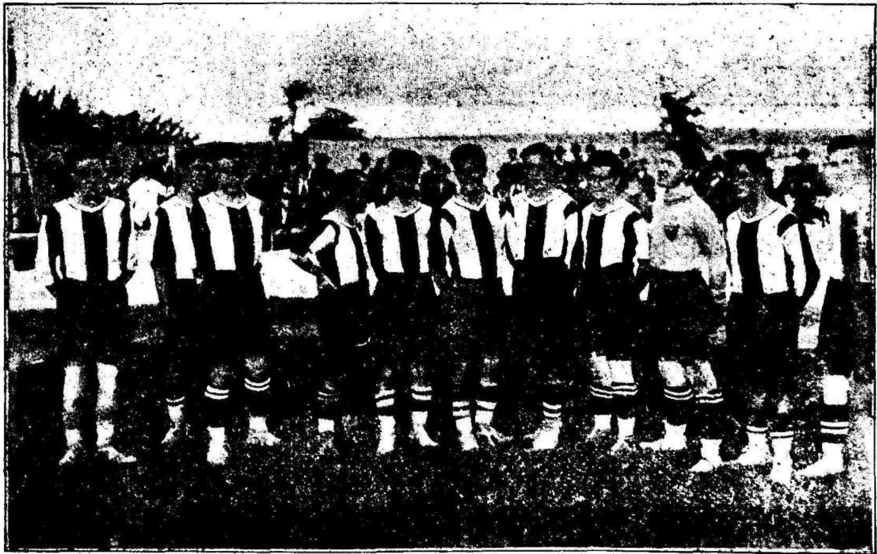
El Club Deportivo Murciano, que ayer fué vencido por el Cartagena, no obstante el entusiasmo que pusieron en la lucha los jugadores del Deportivo