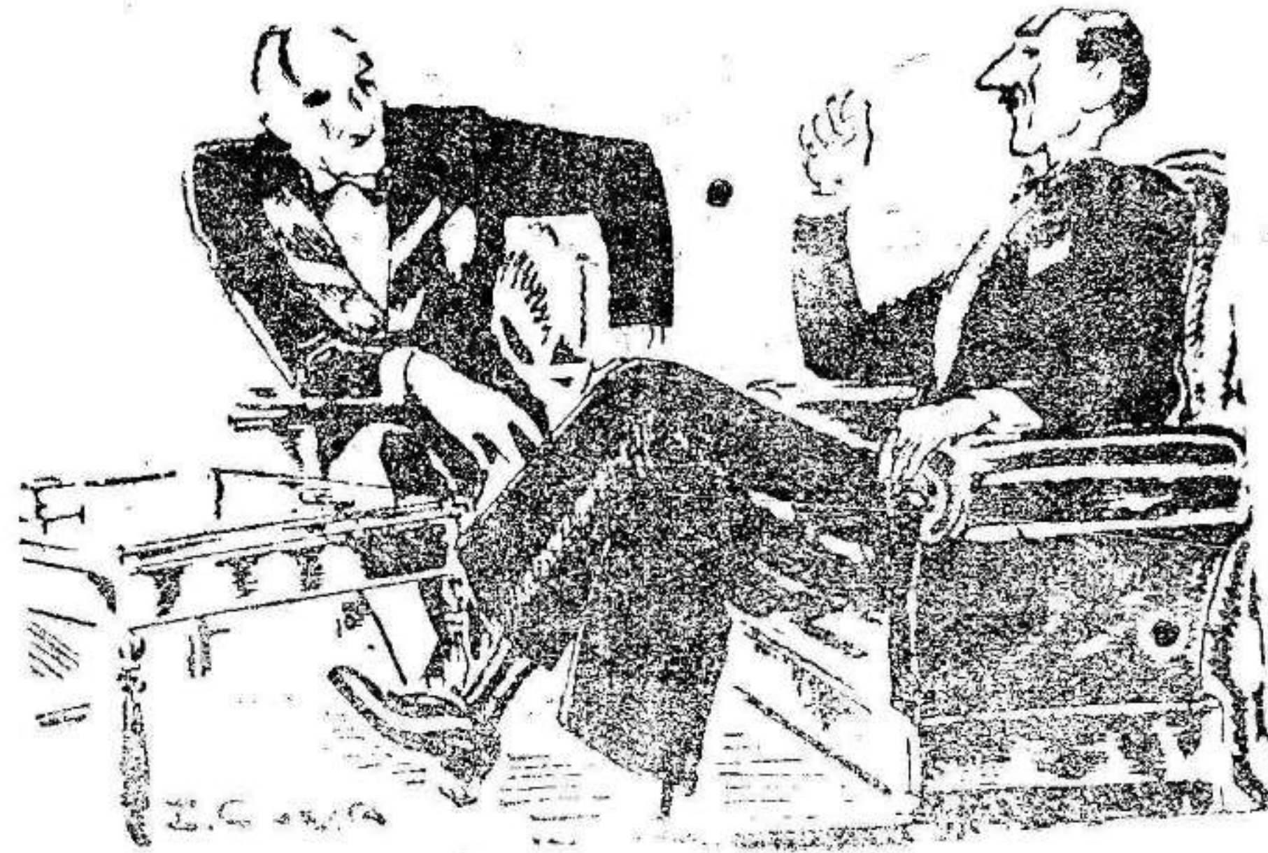
—Usted me aconseja, entonces, que me case con una mujer de un nivel intelectual inferior al mío. —Si le es posible, sí.

Terminó, el señor Martínez Barrios haciendo notar el beneficio que esto suponía para el Cuerpo de intérpretes.