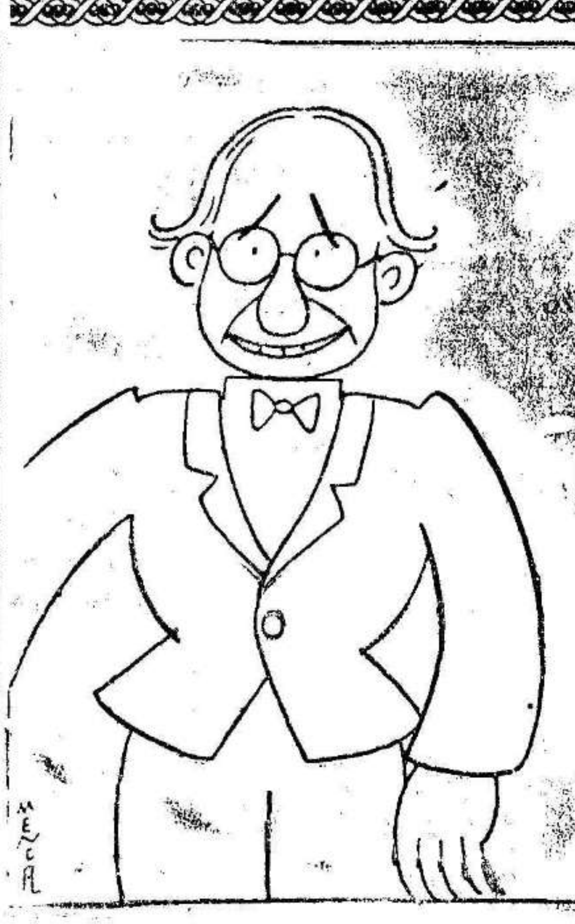
Efectos de la Nueva Constitución. El primer divorcio.

El próximo domingo día 8 de noviembre se celebrará excursión colectiva al Valle. Por la tarde tendrá lugar, ante nuestro refugio de montaña, una charla y un cambio de impresiones con asistencia de toda la tropa. Acto seguido se celebrará el gran concurso de prácticas escoltistas del mes. La hora de salida, así como la distribución del tiempo en las horas libres, se encuentra en las órdenes de las diferentes categorías en sus tabillas del club.