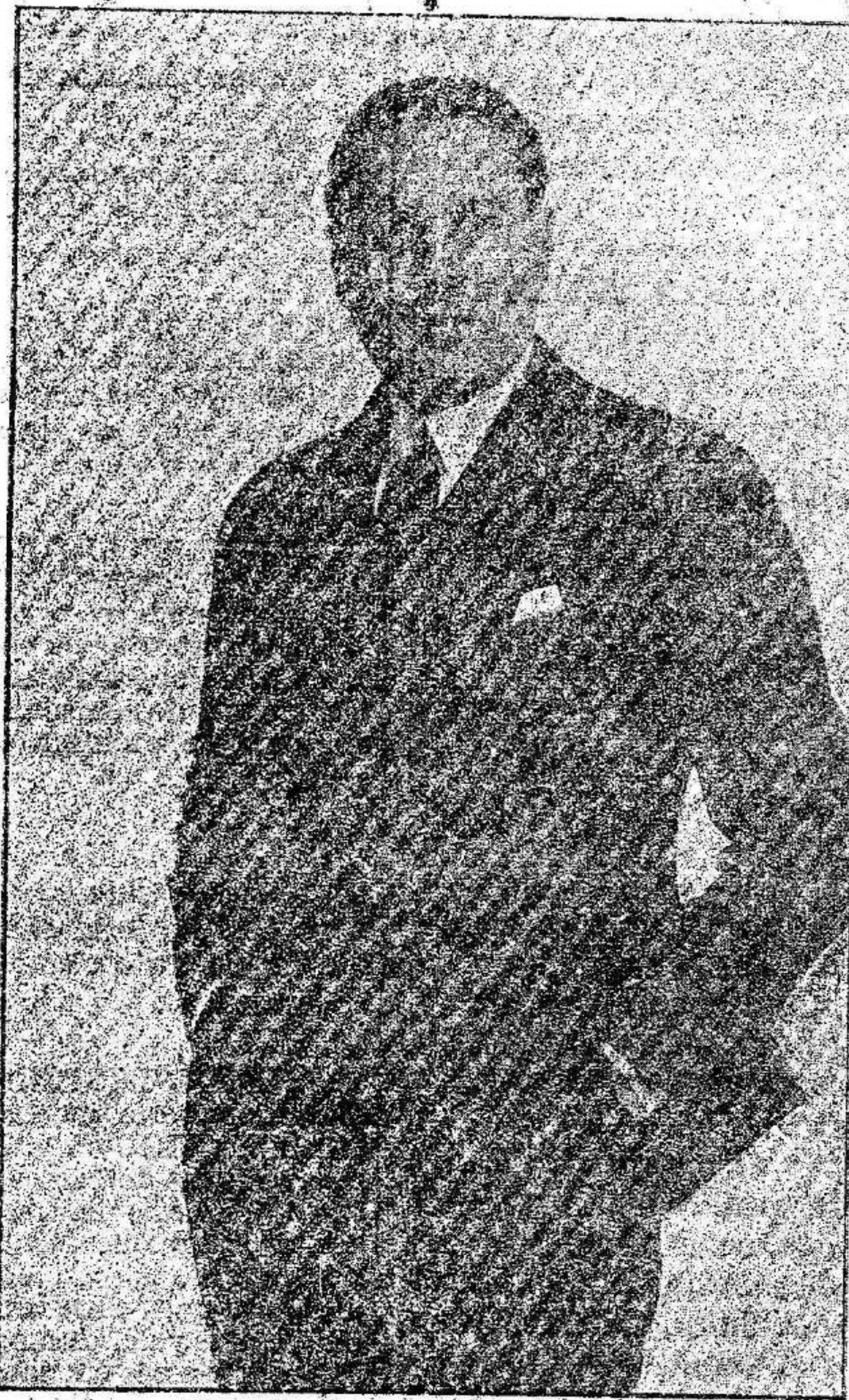
El ilustre Catedrático D. Luis Jiménez de Asúa

La venta de localidades Hoy estarán a la venta las lo-