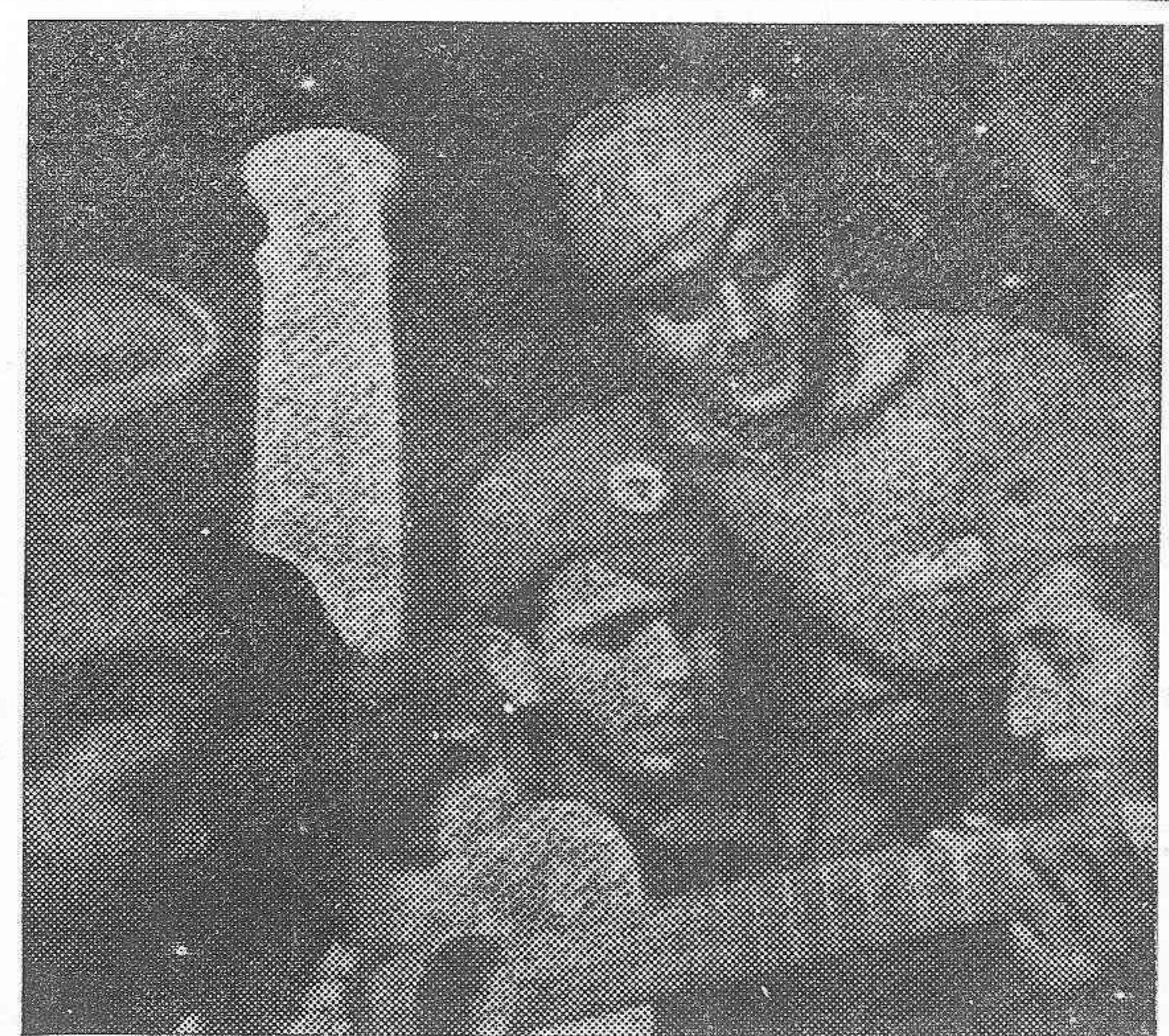
LA JUVENTUD EN LA GUERRA

Por la noche, en el Gran Teatro se celebró un acto que resultó animadísimo.