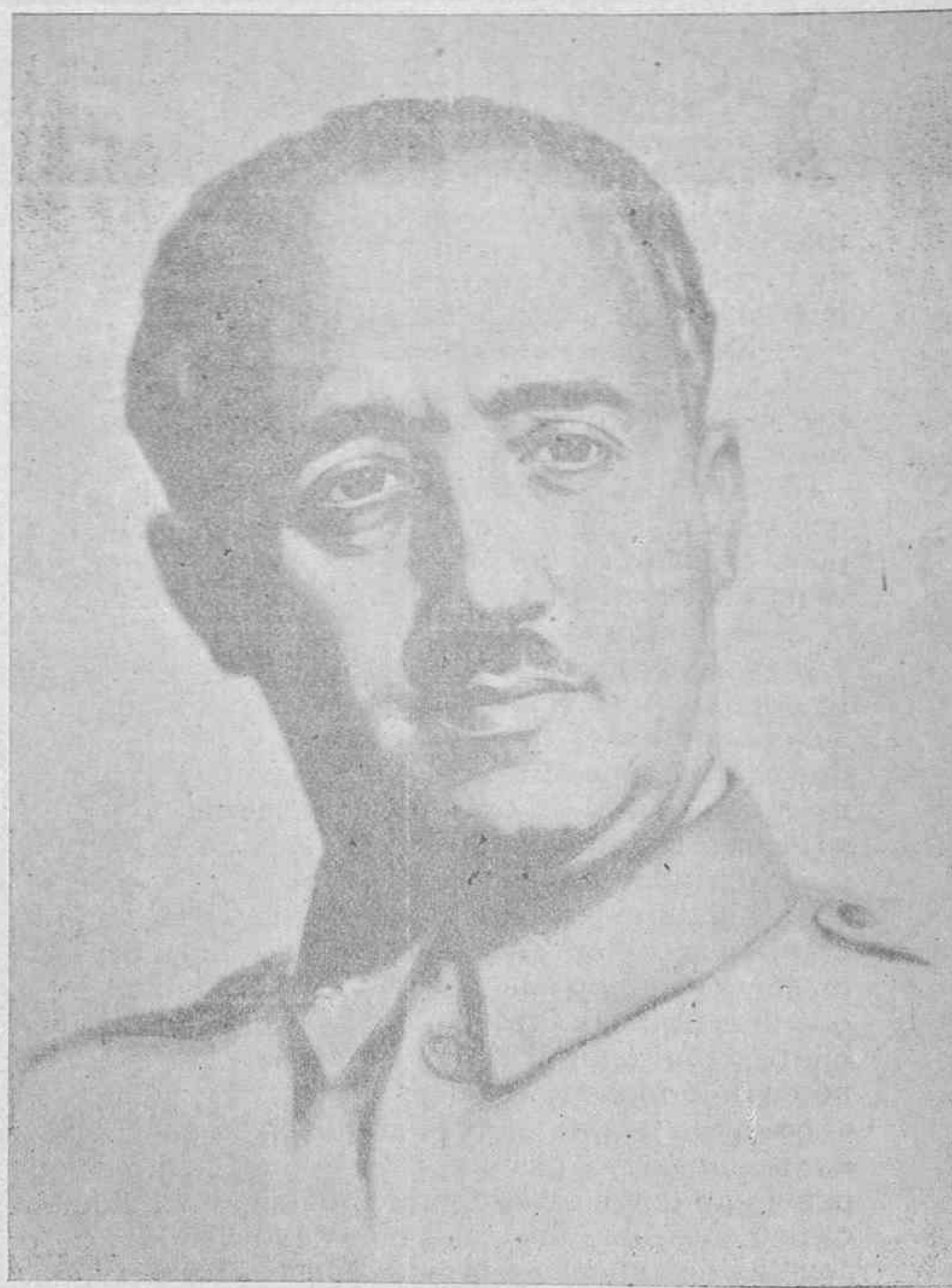
¡FRANCO, FRANCO, FRANCO: A tus órdenes. ARRIBA ESPAÑA!

Más fuerte que nunca, con más unción y fervor que nunca en las palabras, te saludamos con las que, como una reiteración de fe, repiten todos los ecos de España: ¡FRANCO, FRANCO, FRANCO: A tus órdenes. ARRIBA ESPAÑA!