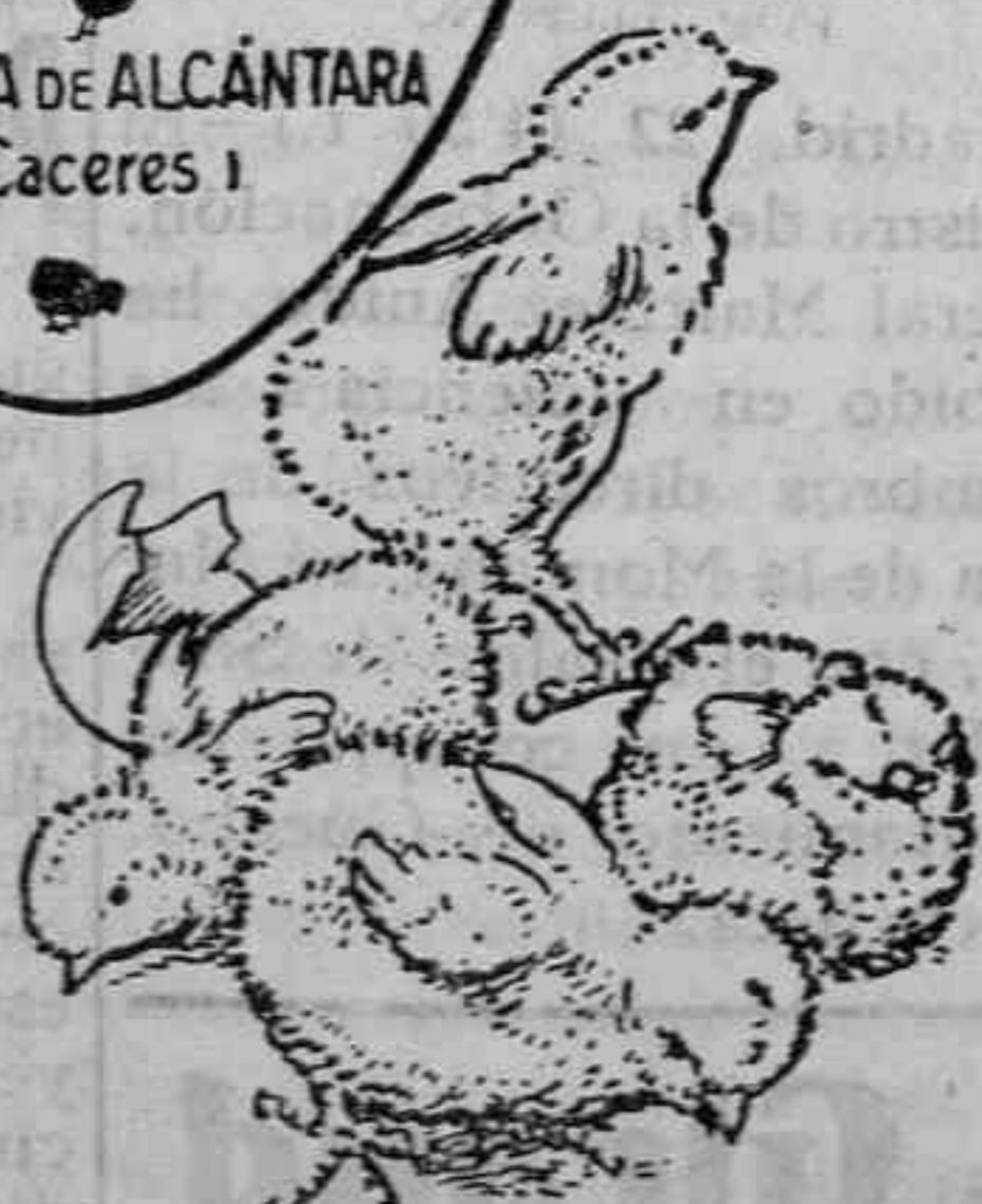
Polluelos recién nacidos