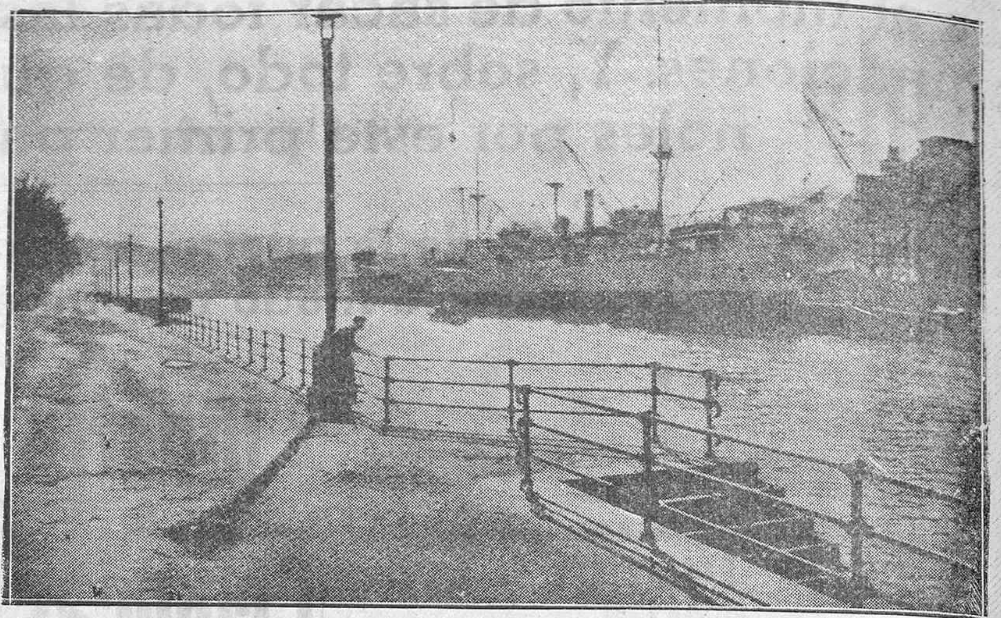
La ría y muelle de Bilbao vistos desde el Campo de Volantín