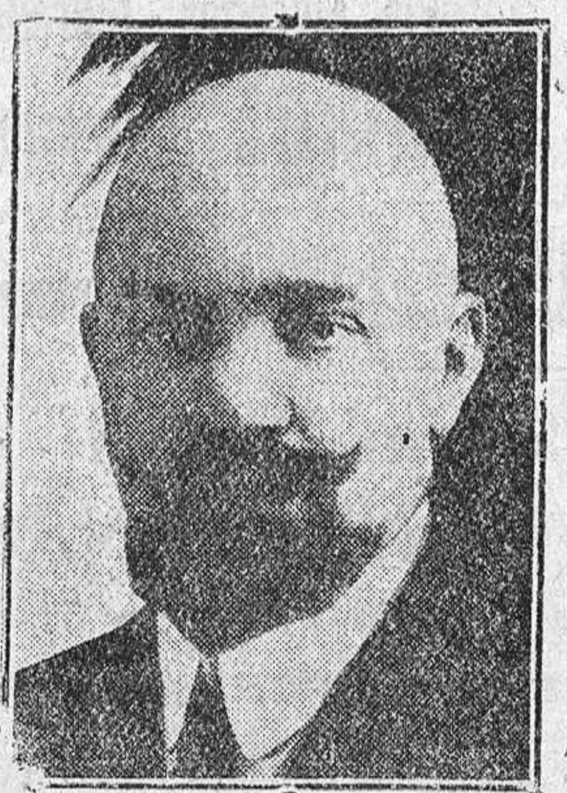
El general Miller que ha sustituido a Kutrepoff en la jefatura de los rusos blancos.

Se vende leña procedente del derribo de los viejos cuarteles de San Francisco. Informarán en LAS DOS HERMANAS, Independencia.