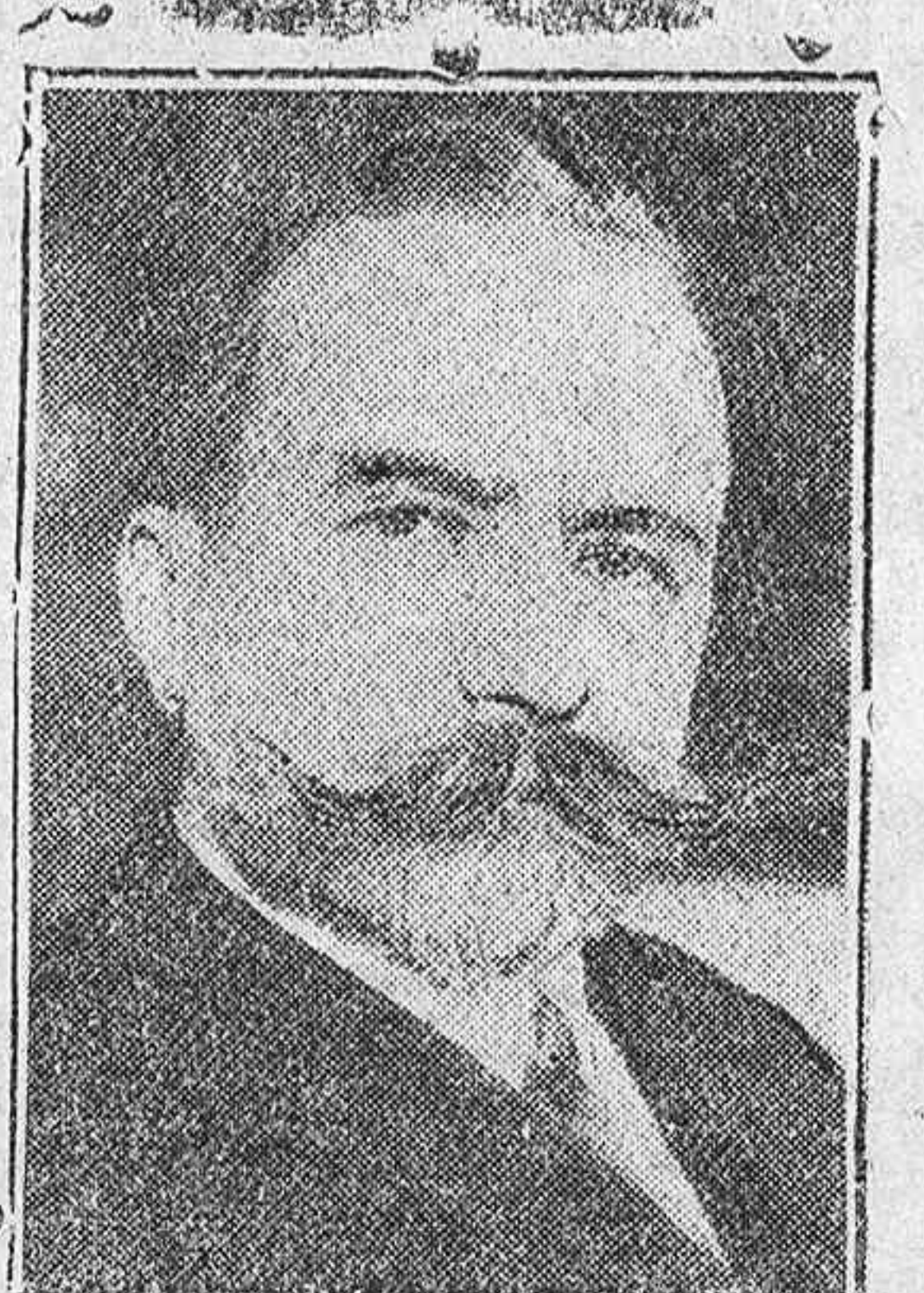
El general Koutepoff jefe de los rusos blancos, de quien se dice ha sido secuestrado. Una alta personalidad ha ofrecido la suma de 500.000 francos a la persona que indique su paradero.