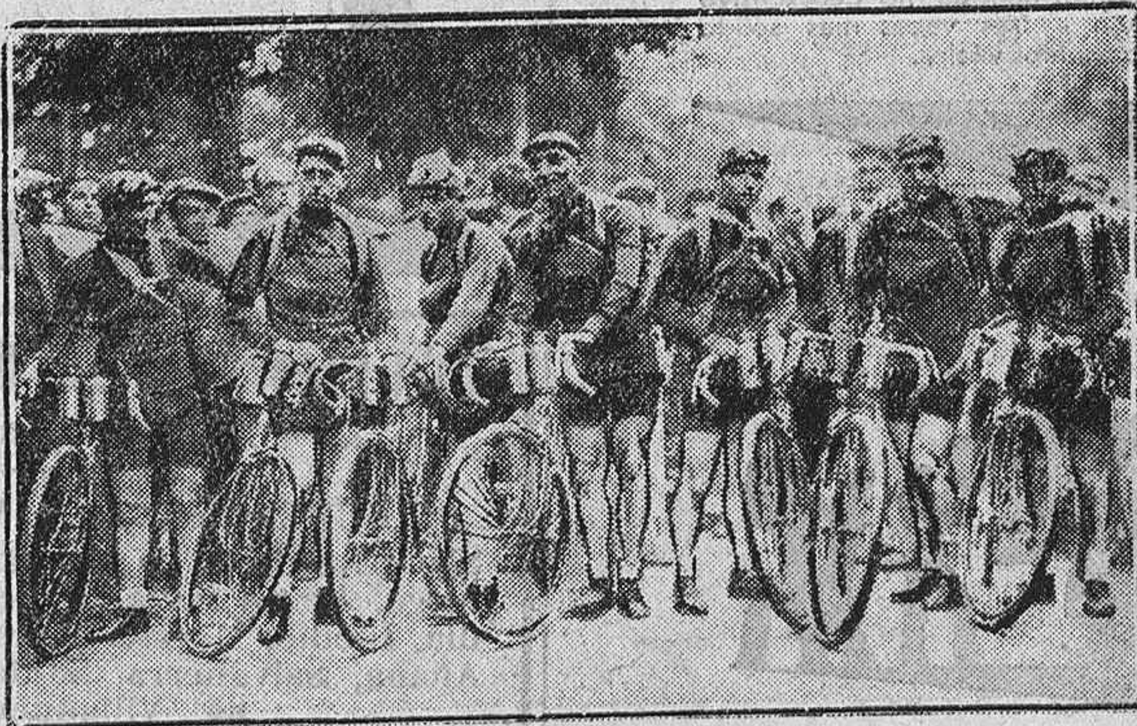
Los ocho corredores españoles participantes en la Vuelta a Francia

Binda, con aire de indiferencia británica, no dá demasiada importancia al trastazo y, en seguida ¡a la caza de la vanguardia!