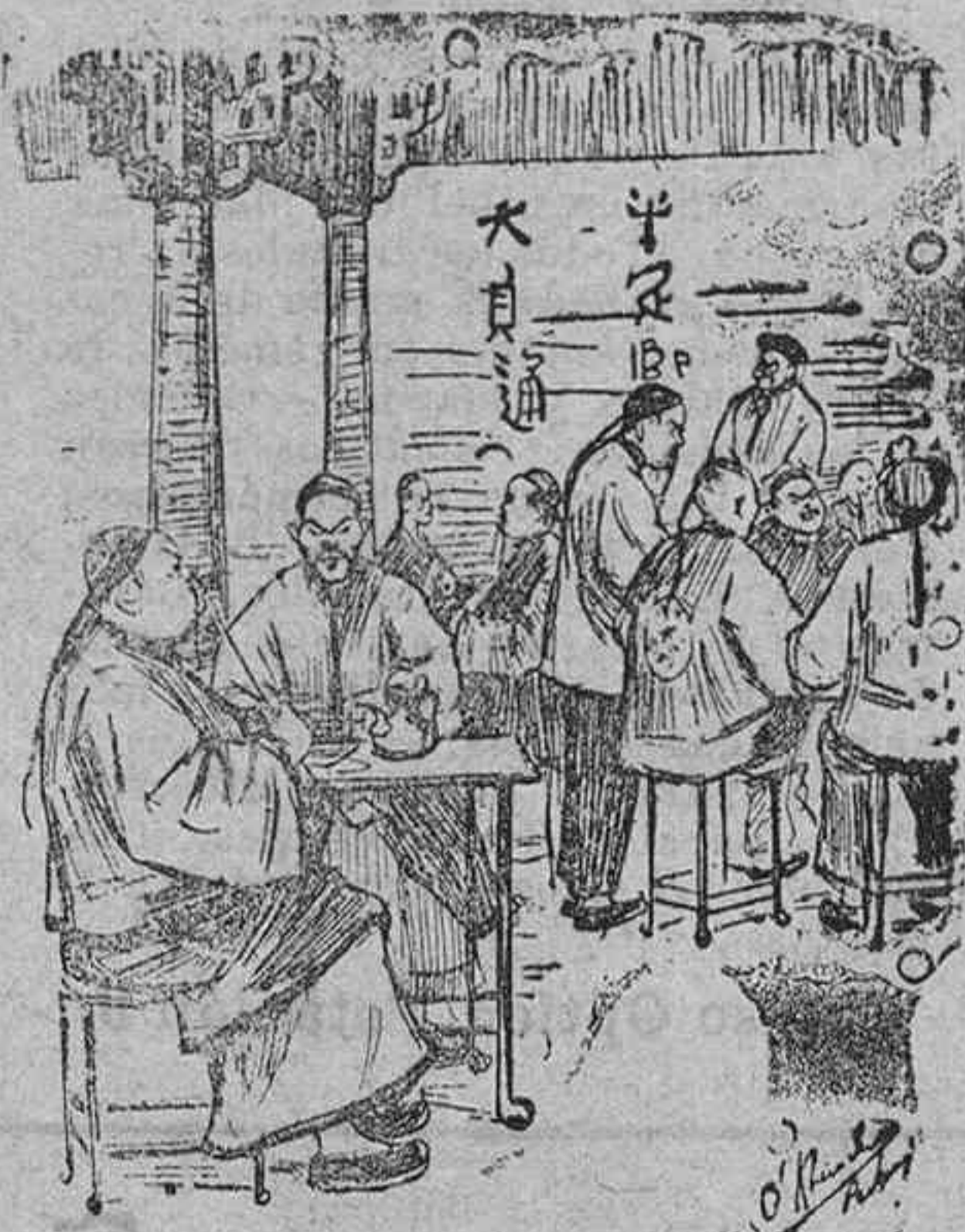
Un café chino.