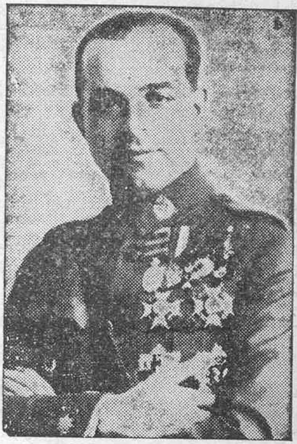
El general Varela, jefe del Ejército del Sur, que realizó la ocupación de Toledo.

Sereno el ánimo, confortado con el triunfo de la liberación, falta sólo esperar que ese horror vivido sea de los últimos horrores que aún tengamos que vivir. Que sea verdad lo que todos sentimos y pensamos ante el glorioso, admirable episodio. Que con Toledo ha sido rescatado el corazón de España.