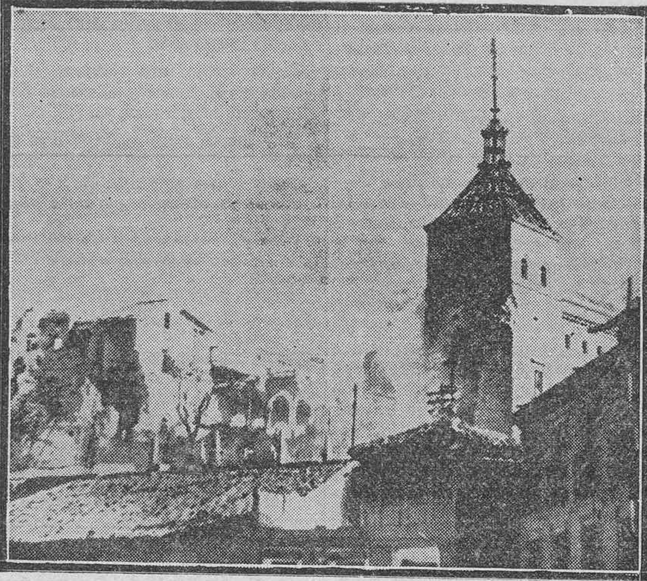
Una de las últimas fotografías obtenidas del Alcázar de Toledo después de los reiterados intentos de los sitiadores para destruir el histórico edificio, donde un puñado de valientes supo resistir las furiosas acometidas de sus enemigos, manteniéndolos a raya con una tenacidad y bravura que han causado la admiración del mundo.