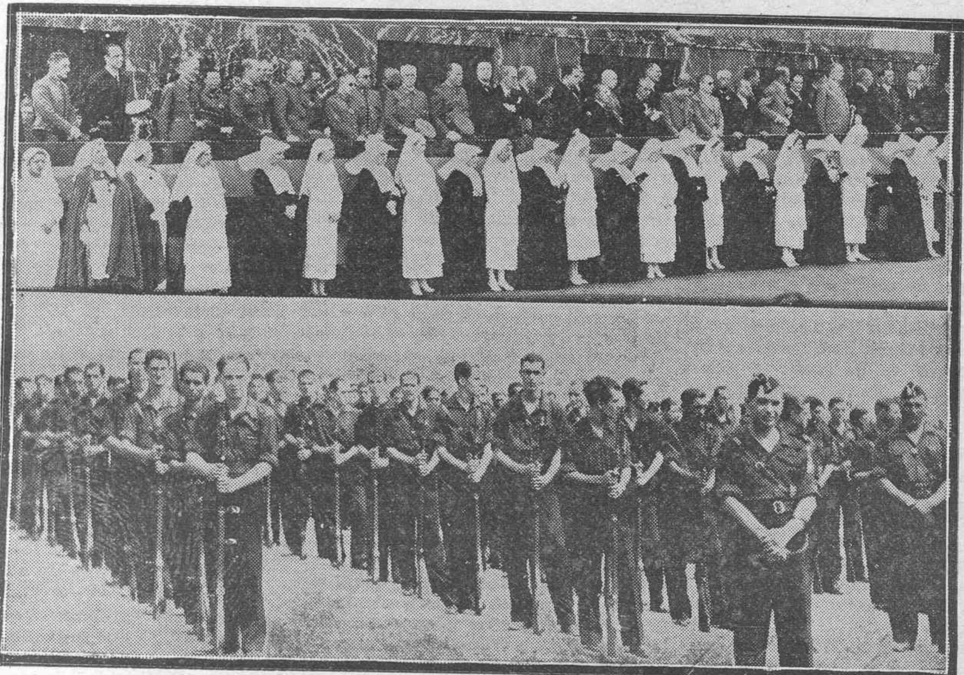
La tribuna de autoridades y la formación de Falange Española en la Misa de campaña del domingo.

El domingo por la mañana se celebró en esta capital el acto de la Jura de la bandera bicolor, la enseña nacional restablecida por la Junta de Burgos, por todos los oficiales, suboficiales, clases y soldados que no habían prestado juramento ante ella. El acto tuvo lugar en la explanada del muelle, ante un altar adosado al costado Este del monumento a la Virgen de Candelaria, donde se dijo una misa de campaña antes de comenzar la ceremonia del juramento y en presencia de un enorme gentío ya que, sin exageración, puede decirse que todo Santa Cruz se dio cita en aquel lugar, para asistir a una fiesta de cuya brillantez y alto sentido patriótico y emocional poco sería cuanto pudiéramos decir.