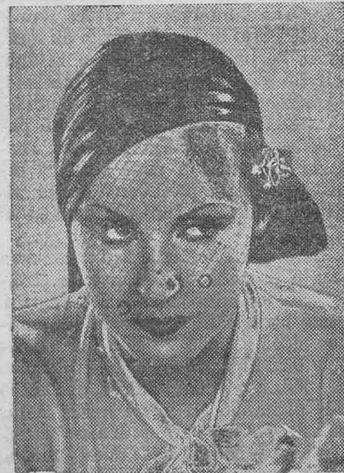
Brigitte Helm, la heroína de tantas películas, obtiene un señalado triunfo en la interpretación de "Oro!", el último gran acontecimiento presentado por la Ufa