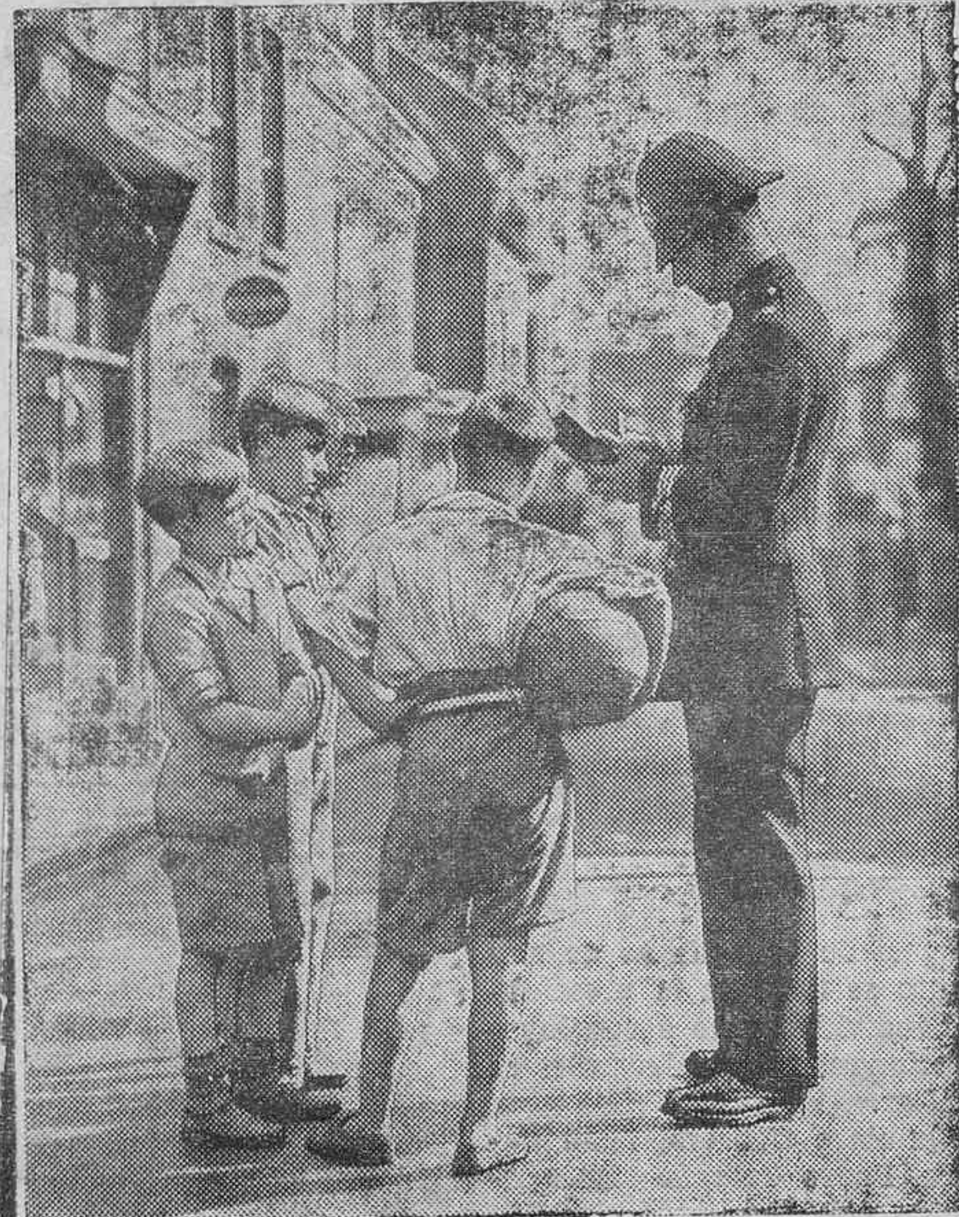
LA MALDITA AFICION AL FUTBOL.—Ved aquí a un «policeman» inglés que muestra toda su severidad con unos chicos que jugaban al fútbol en plena calle de Londres.