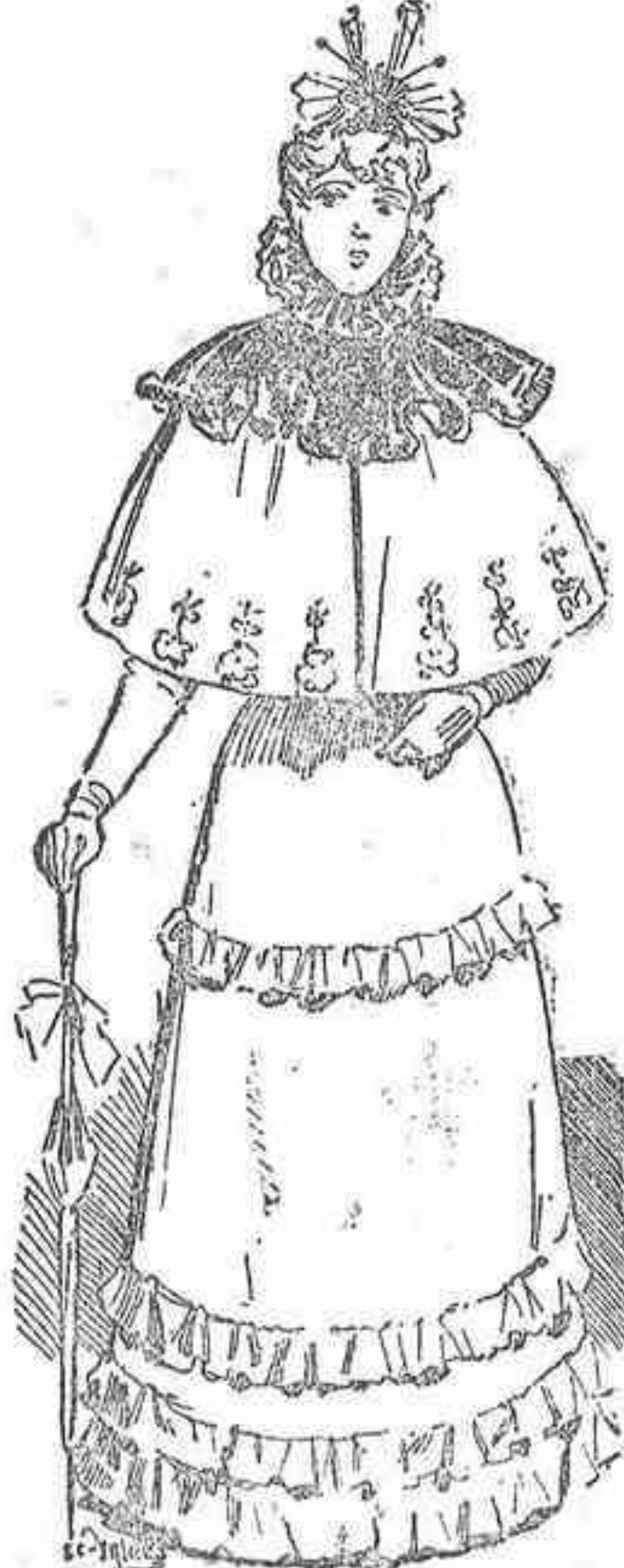
Vestido de paseo.

Las bridas son de la misma cinta que las guarniciones y se anudan en grandes lazos.