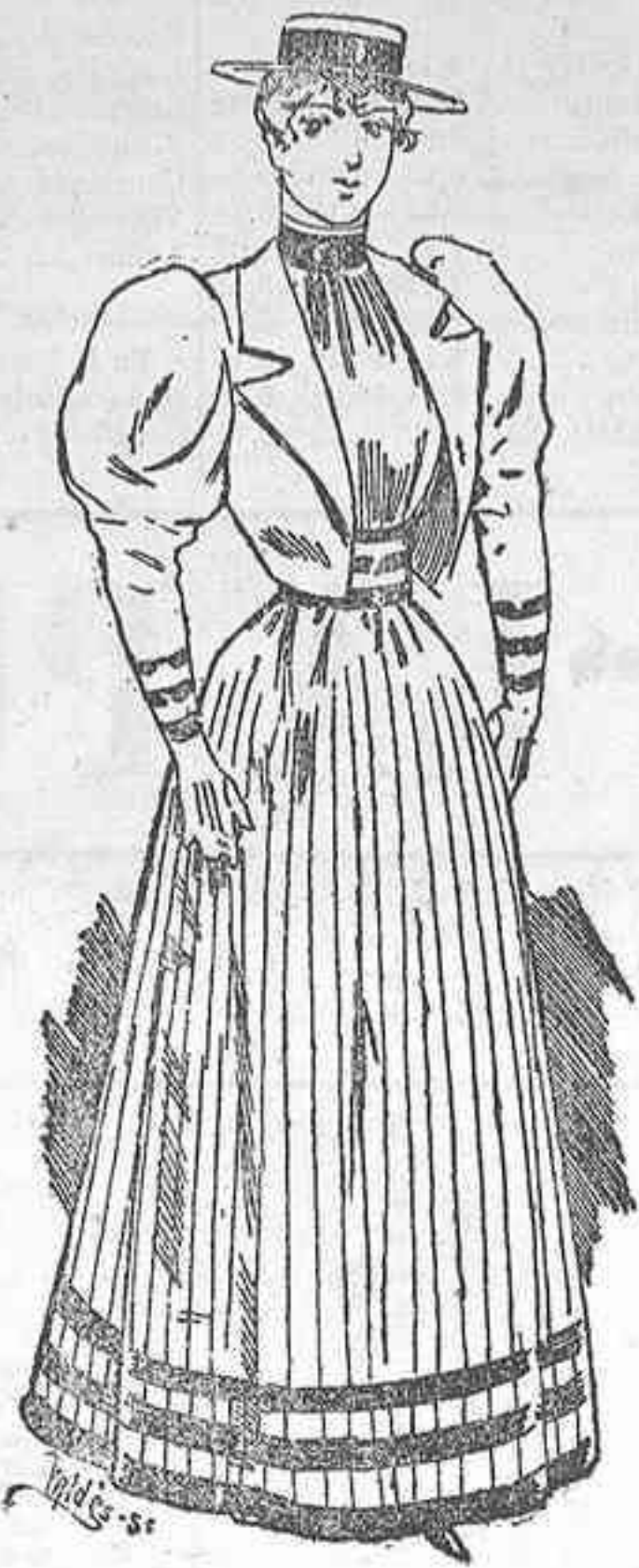
Traje de mañana.

Una preciosa pelerina forma Enrique IV de la misma tela con aplicaciones de seda bordadas en colores pálidos completa el conjunto que resulta elegantísimo. Pero para que esta pelerina forme juego con los adornos del vestido se guarnece con un ancho volante y un agremán de lentejuelas malva unido á otro más pequeño, puesto en sentido inverso y formando cuello médico.