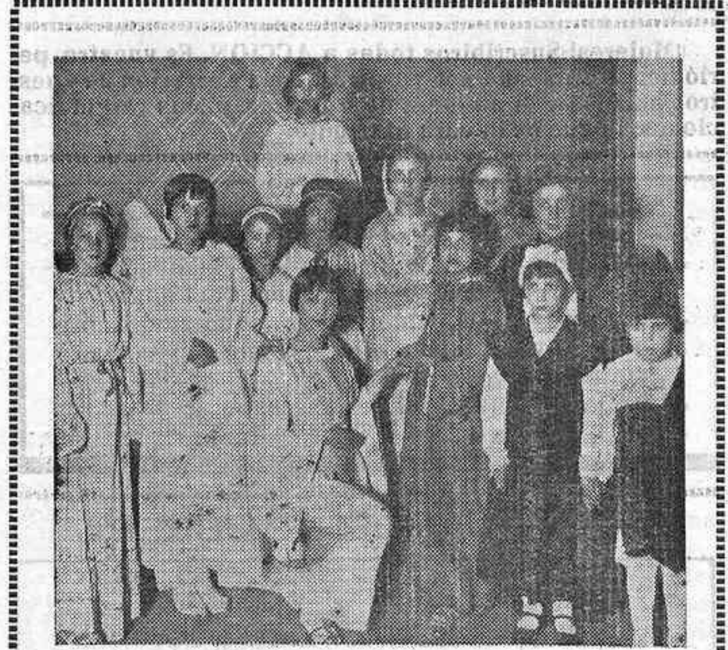
Grupo de niñas que tomaron parte en la velada artística del Día Catequístico.

Diez y media de la mañana... En el «Salón Ideal» y con una concurrencia numerosa y con también numero-