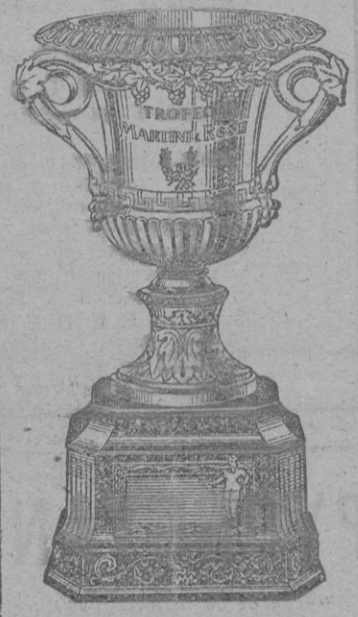
TROFEO MARTINI & ROSSI