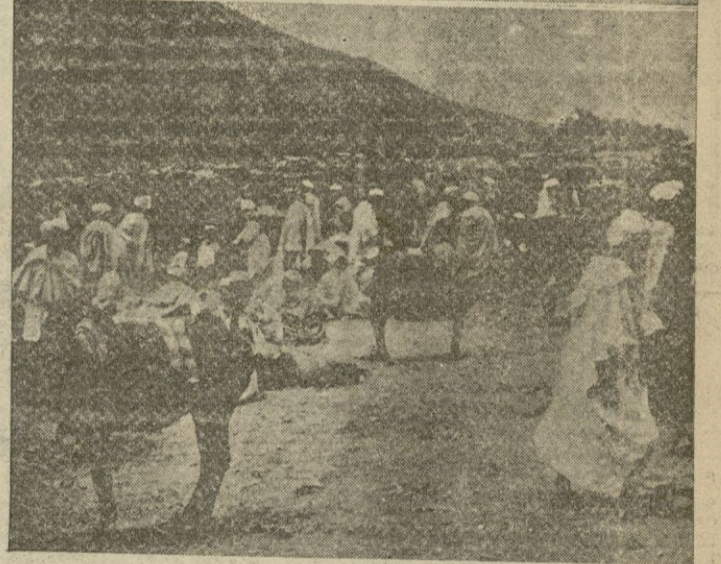
Inni. — Escenas en el Zoco de Haz de Bifurna. — (Foto "Gira")