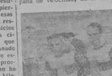
HERMANOS TIMONER ¿Para cuál de los dos será el título en disputa?

Esta noche en el Velódromo de Tirador y bajo la organización del Veloz Sport Balear, tendrán lugar las finales del Campeonato de España de Velocidad, en la cual —