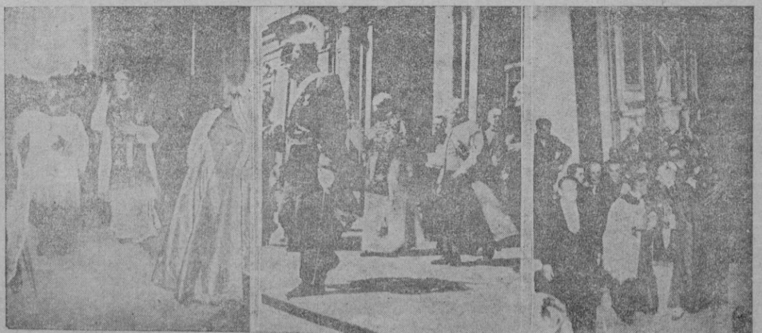
S. S. EL PAPA, PEREGRINO DEL AÑO SANTO ROMA. — He aquí tres momentos de la visita jubilar a las Basílicas Mayores, como peregrino del Año Santo del Romano Pontífice, Pio XII. Las "fotos" recogen el momento de visitar San Juan de Letrán, Santa María La Mayor y San Pablo.

Tortosa 1. — Desde hace 24 horas reina un furioso temporal con ráfagas de viento huracanado, que ha causado cuantiosas pérdidas en la agricultura de los pueblos de la comarca. La temperatura ha descendido notablemente. —Cifra.