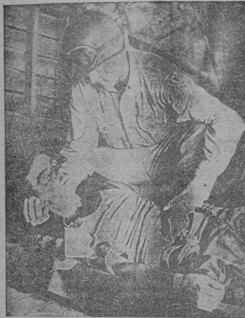
He aquí una imagen, muy elocuente, de la guerra en Corea. Un capellán castrense asiste a un soldado norteamericano, herido de gravedad, en las primeras líneas de algún lugar a lo largo del frente coreano.