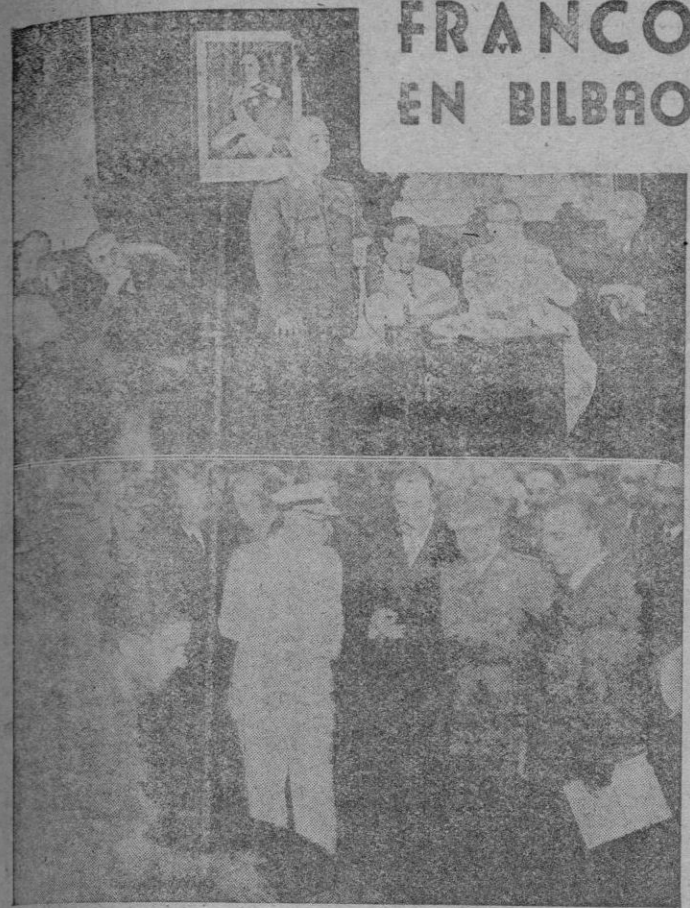
Baracaldo. — S. E. el Jefe del Estado, Generalísimo Franco, durante su discurso pronunciado en el Ayuntamiento con motivo de haberle sido impuesta por el Alcalde de la ciudad, la Medalla Unica de Baracaldo. — Abajo: S. E. el Jefe del Estado, acompañado de las personalidades de su séquito, visita la fábrica Firestone.

SE FIRMARA MANANA Washington 22.—Las autoridades norteamericanas informan que se ha llegado prácticamente a un acuerdo para modificar el convenio aéreo entre España y los Estados Unidos, en forma de que las líneas aéreas españolas puedan utilizar los aeropuertos de Miami y San Juan de Puerto Rico en sus servicios al Caribe. Se espera que el convenio sea firmado el sábado próximo.—Efe.