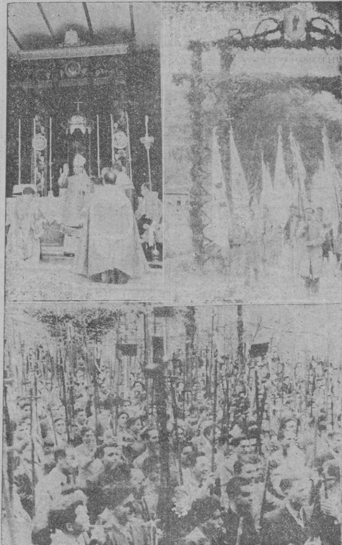
Varios aspectos de los actos celebrados en Lluch, con motivo del inicio de la peregrinación a Santiago de los jóvenes de Acción Católica de Mallorca.

a Compostela porque, además de espíritu que os mueve, ninguno sería capaz de dejar a la Virgen de Lluch por los caminos de España sin su guardia de honor. A Santiago irán todos para postrarse cien mil ante las cenizas del Apóstol Santiago. ¡A Santiago, peregrinos! De Lluch ya habeis venido. A Santiago ya habeis marchado ¡U!reya! ¡Sois peregrinos auténticos de Santiago!