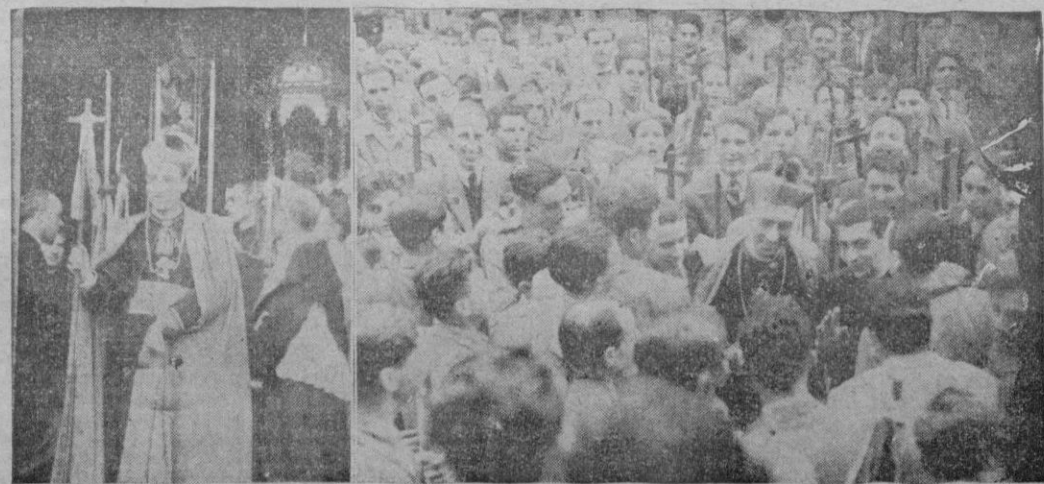
Los aspectos de la estancia del Excmo. Sr. Obispo Mallorca en el Congreso de Lluç. En el primero se ven con el bordón de peregrino; y en el otro, a su llegada al Monasterio de la Reina de Mallorca, rodeado de los jóvenes de Acción Católica.