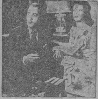
Una escena del film, con Loretta Young y Brian Aherne.

PRINCIPAL y ORIENTAL. No una, dos o tres son las noches de terror y risa las que viven una pareja de recién casados de la que el esposo es, por contera, un novelista político.