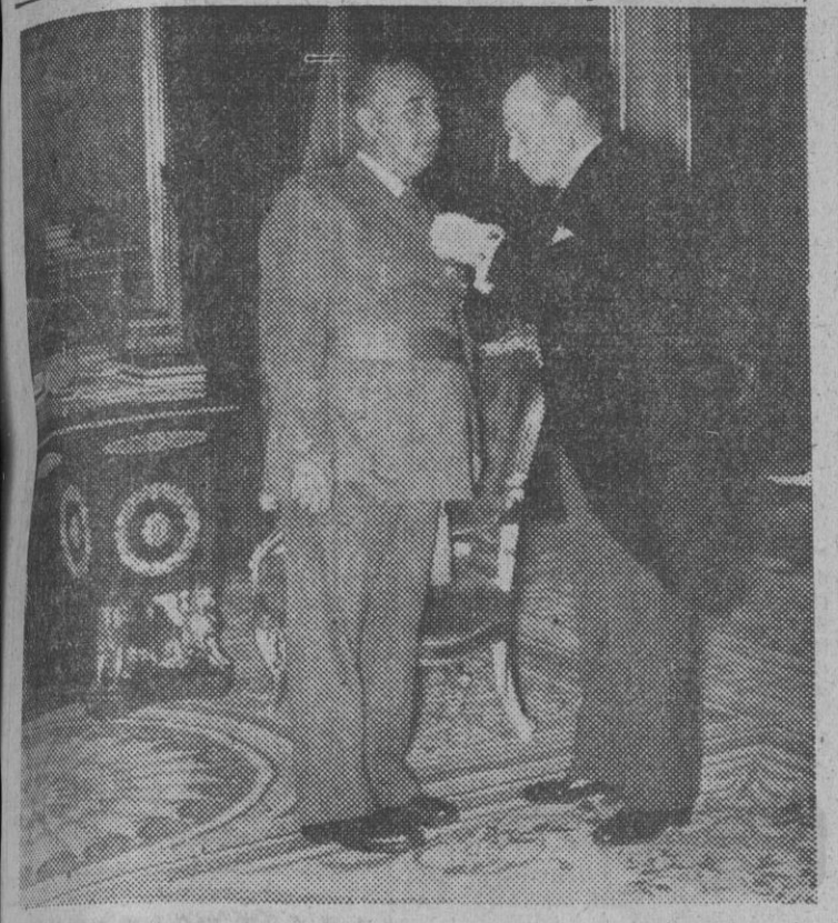
El jefe del Estado recibió ayer, en audiencia, a la Diputación Foral de Navarra, cuyo presidente hizo entrega al Caudillo de la Medalla de Navarra.