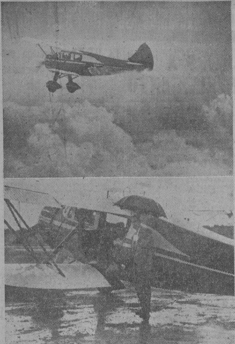
En Nueva York se han ensayado con éxito, una vez más, las lluvias artificiales, mediante "bombardeo" de las nubes con hielo seco. En la fotografía superior se ve al avión causante de la lluvia, y en la otra, los tripulantes del aparato posan satisfechos ante el fotógrafo, después de haber conseguido su objetivo.