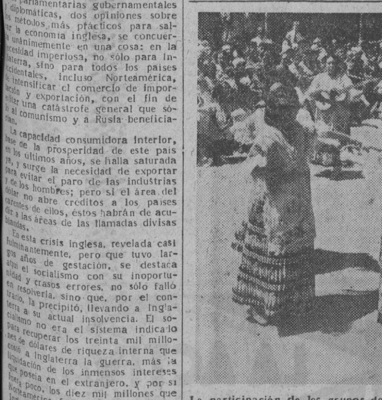
La participación de los grupos de Coros y Danzas españolas han tenido un clamoroso éxito en Lausana. En la foto vemos al grupo de Coros representativo de Barcelona, durante una de sus actuaciones.