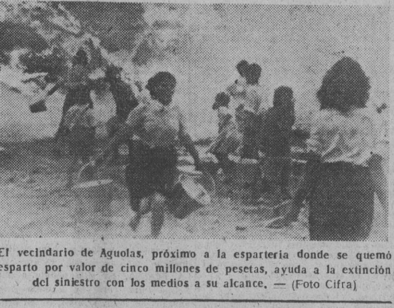
El vecindario de Aguilas, próximo a la espartería donde se quemó esparto por valor de cinco millones de pesetas, ayuda a la extinción del siniestro con los medios a su alcance.