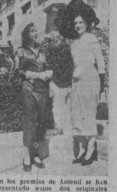
En los premios de Anteuil se han presentado estos dos originales modelos que han llamado poderosamente la atención, principalmente por sus amplios sombreros