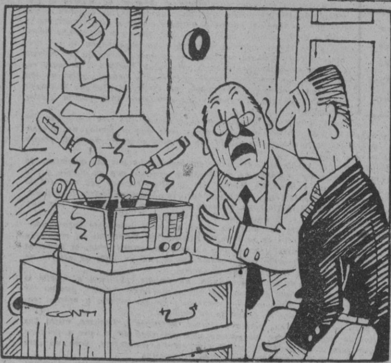
—Fijese, tuve una mala idea al escuchar por radio el discurso de Vichinsky.