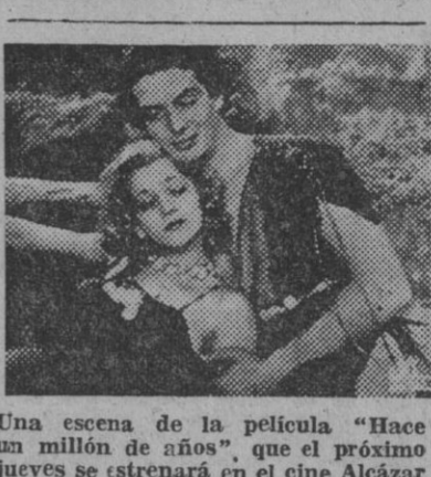
Una escena de la película «Hace un millón de años» que el próximo jueves se estrenará en el cine Alcázar