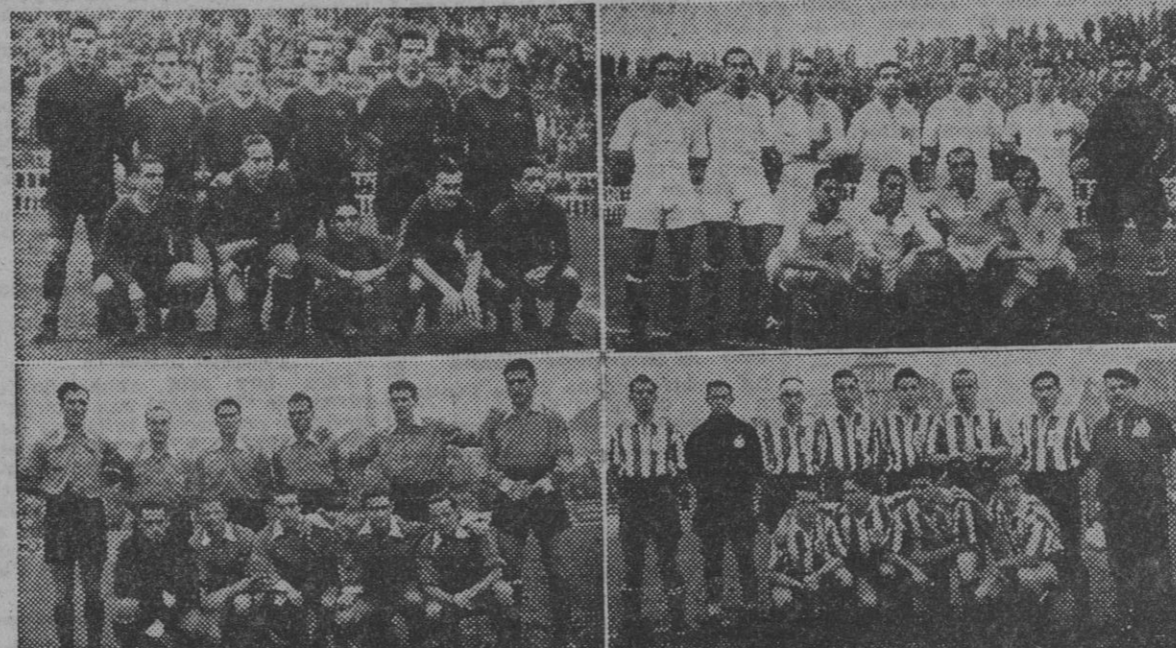
Los equipos del Barcelona, Sevilla, Sabadell y Deportivo de Coruña, que jugaron ayer en Las Corts y la Cruz Alta.