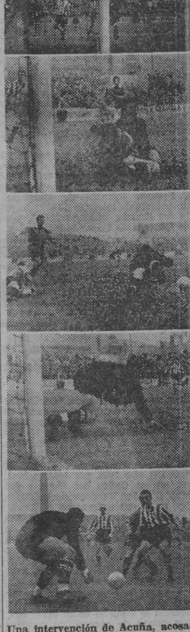
Una intervención de Acuña, acusado por González I, que falla el remate. Y así sucesivamente, vemos otras intervenciones del meta coruñés, en el partido jugado ayer